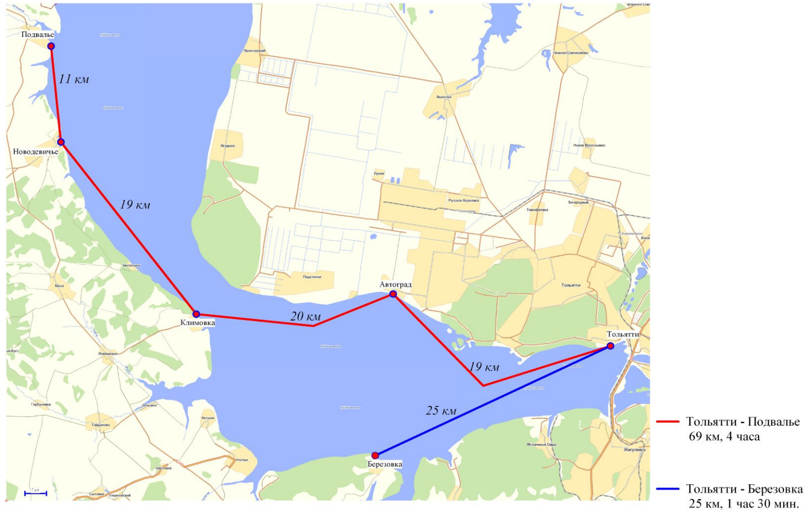
Схема речных пригородных пассажирских перевозок ОАО "Порт Тольятти"