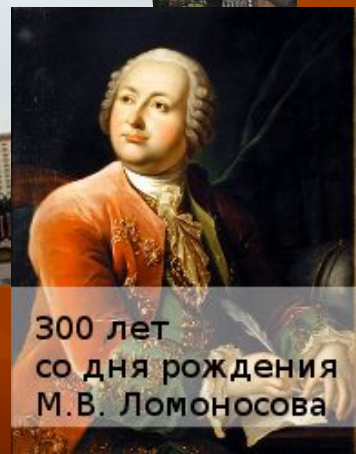
300 лет со дня рождения М.В. Ломоносова