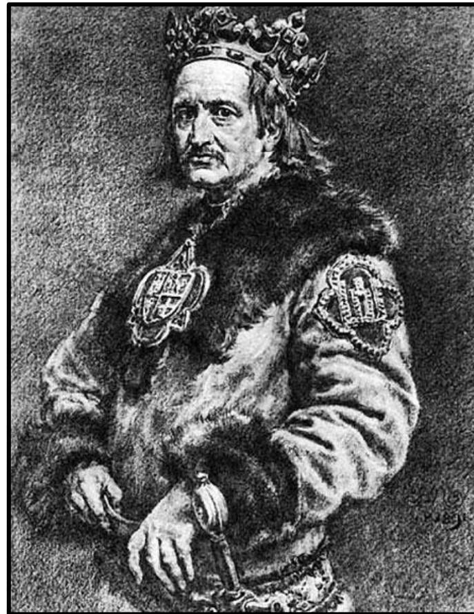
• Ягайло Литовский князь Король Польши