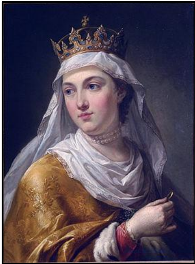
• Ядвига Королева Польши