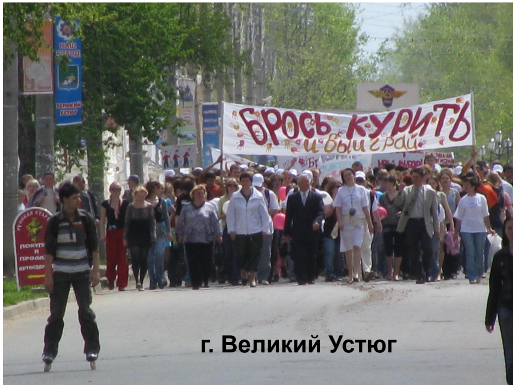
г. Великий Устюг

акция «Брось курить и выиграй» (1301 участник)