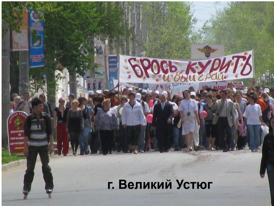
г. Великий Устюг

акция «Брось курить и выиграй» (1301 участник)