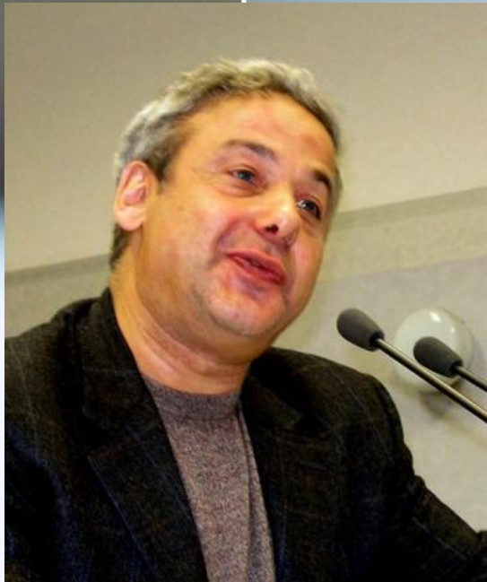
Александр Григорьевич Асмолов, д.пс.н.