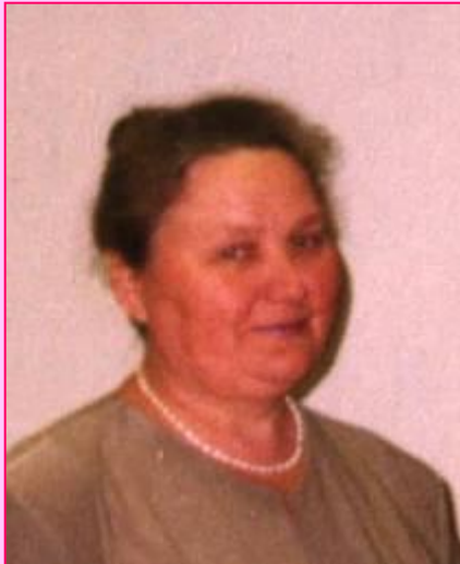
Зам.директора по УВР