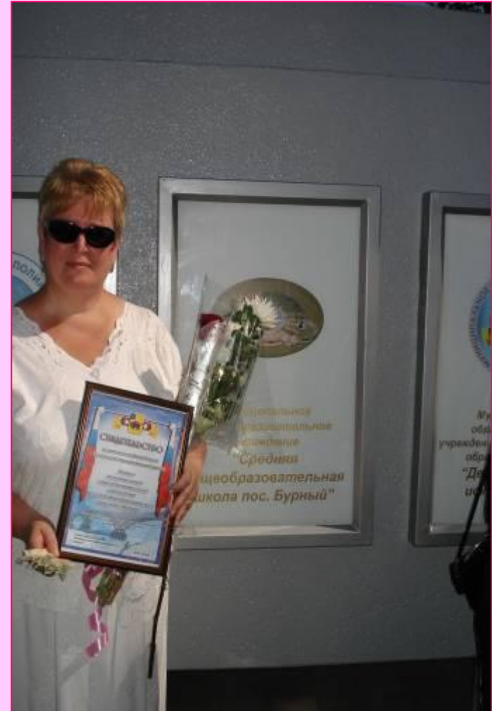
На районной доске почёта