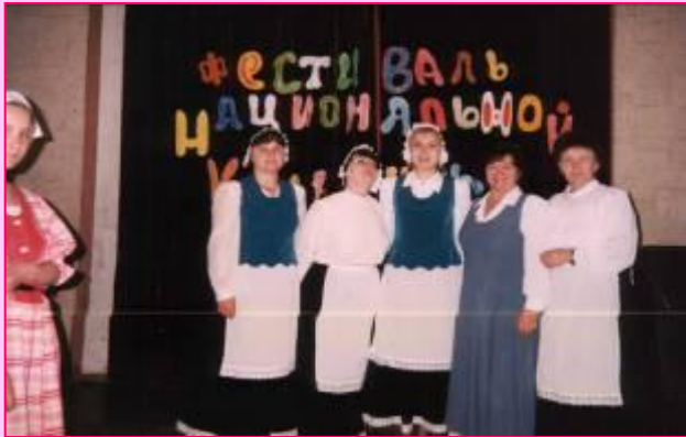
Фестиваль национальных культур