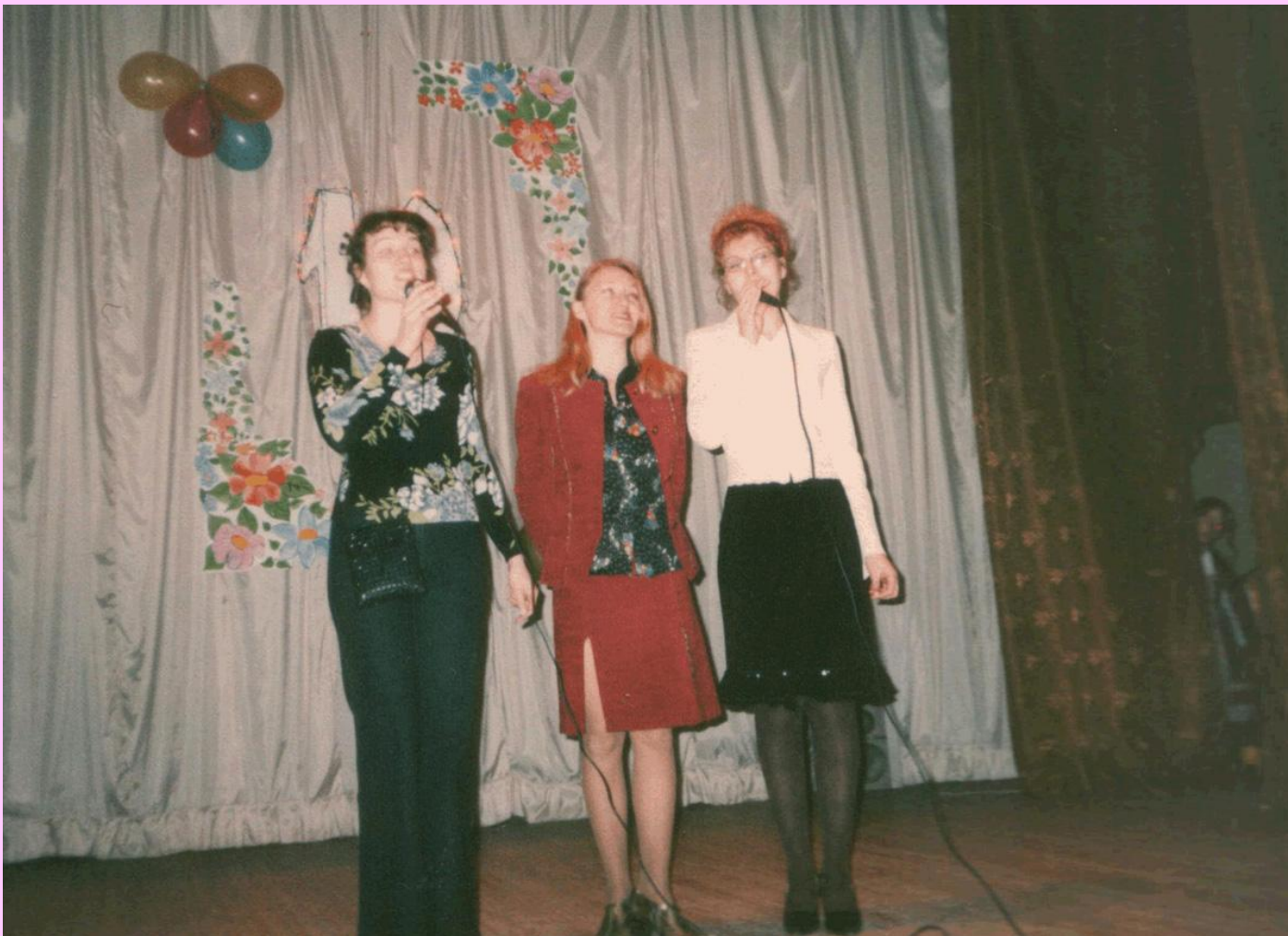
Концерт ко Дню пожилого человека.