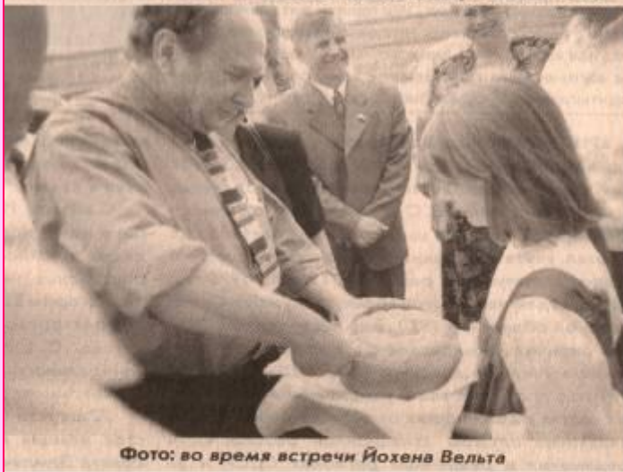
Фото: во время встречи Йохена Вельта

В конце июля этого года наш регион посетил уполномоченный Федерального Правительства Германии по делам переселенцев, член бундстага ЙОХЕН ВЕЛЬТ