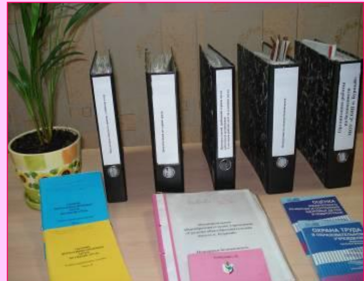
Уголок по охране труда