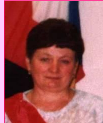
Зам.директора по ВР