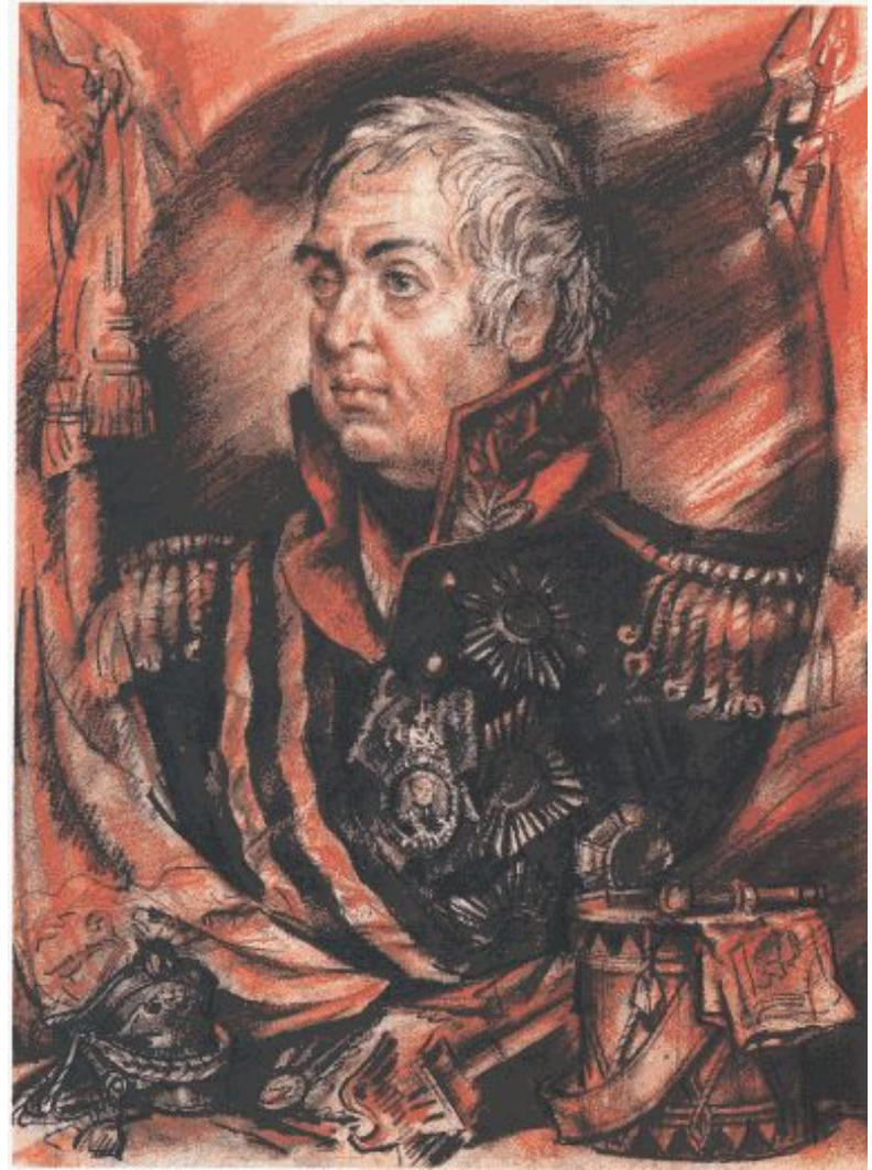
Иванов Ю. Портрет Кутузова М.И. 1990г