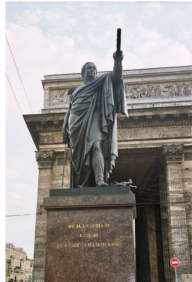
Бюст Кутузова, Тирасполь