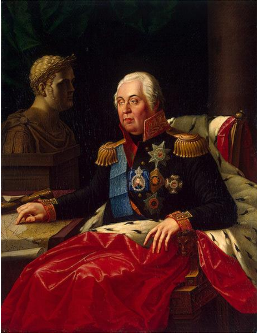
Портрет Михаила Кутузова – Олешкевич Юзеф.