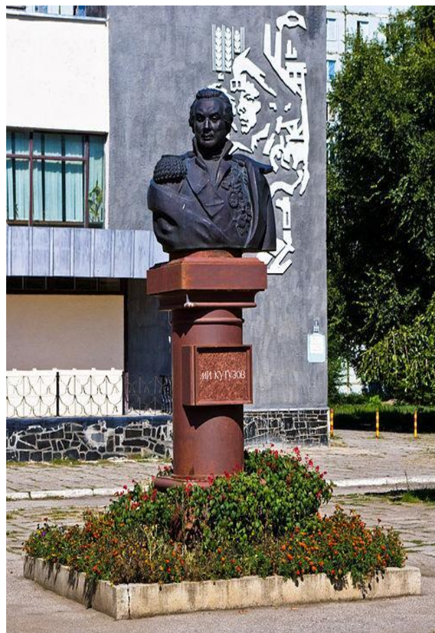
Скульптор –Б.И. Орловский, Санкт -Петербург