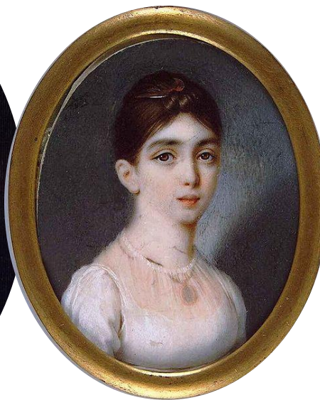
Дарья (1788 – 1854)