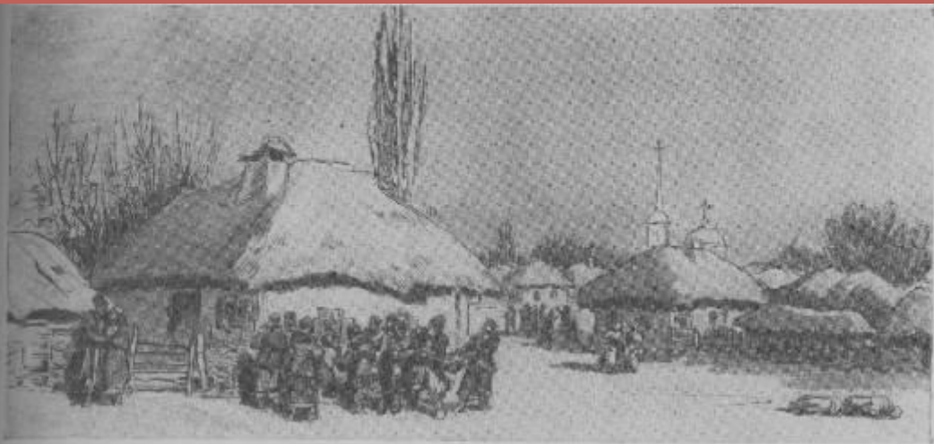
«Ночь перед Рождеством». Колядки.