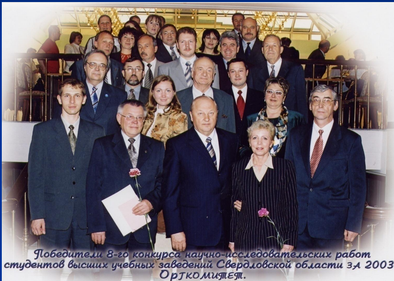
Победители 8-го конкурса научно-исследовательских работ студентов высших учебных заведений Свердловской области за 2003г. ОрТКО митял.

По итогам 2009 г. на конкурс представлено 402 работы, 27 из которых получили премии за 1,2, 3 место по каждому направлению