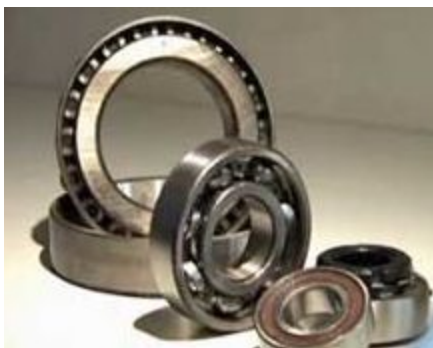
Машиностроение, электроника, приборостроение