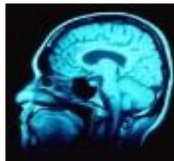
Медицина и фармакология