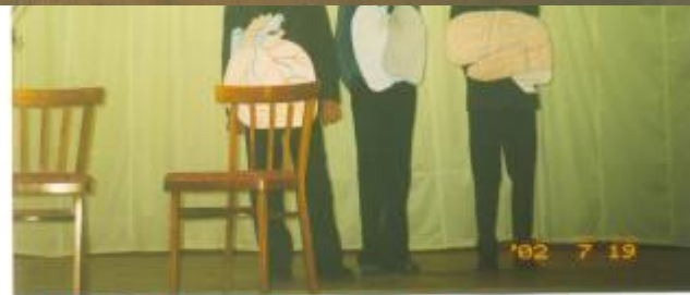
Это мы - Ваши органы