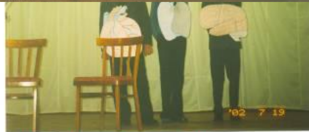
Это лы - Ваш организм