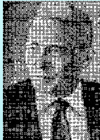
6. Колмогоров А. Н.