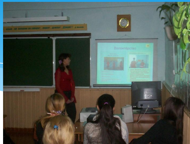
Мастер – класс «Как организовать дело»