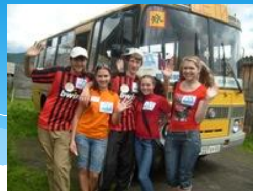
Организаторы и ведущие социальных акций в районе и Крае.