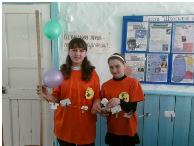
Акция «Я выбираю ЗОЖ»