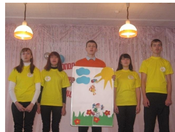
Победители районного конкурса волонтеров