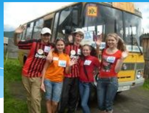
Организаторы и ведущие социальных акций в районе и Крае.