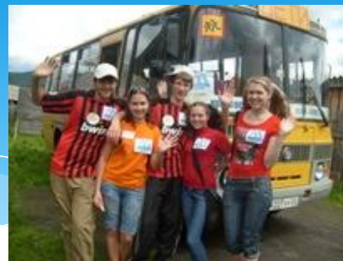
Организаторы и ведущие социальных акций в районе и Крае.