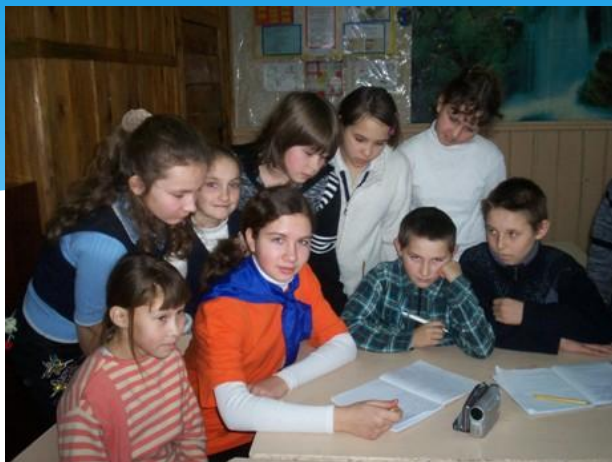
Круглый стол «Умешь сам- научи другого»