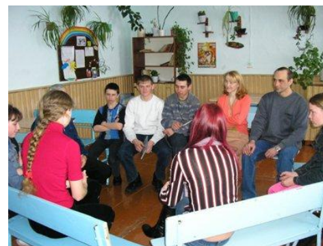
Тренинг управления группой.