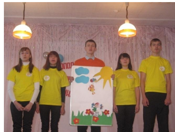
Победители районного конкурса волонтеров