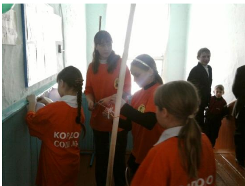
Обучающий модуль мастер – класс «Организация акций».

Создание условий для приобретённых знаний