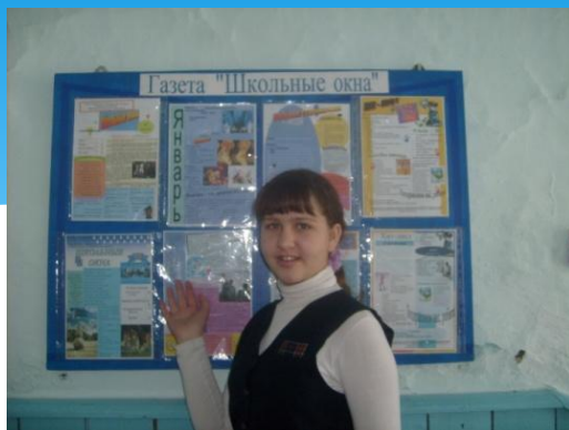
Победитель Всероссийского, Краевого, районного конкурса «Лидер ученического самоуправления»