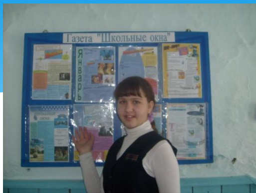
Победитель Всероссийского, Краевого, районного конкурса «Лидер ученического самоуправления»