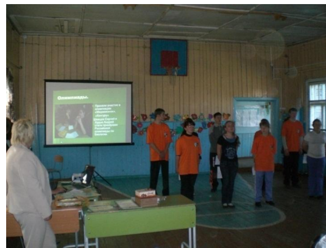
Выступление агитбригады волонтеров