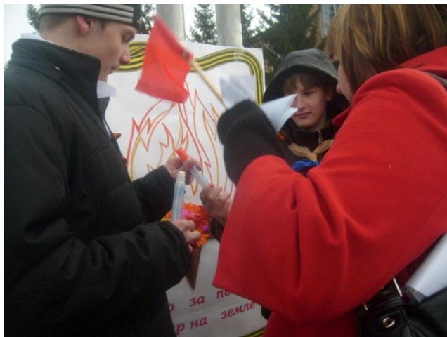
Участники районной ассамблеи «Мы вместе»