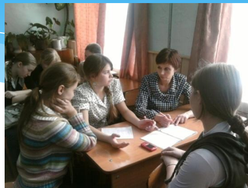
Проведение обучающего модуля «Жизнь без вредных привычек»

Создание условий для приобретённых знаний