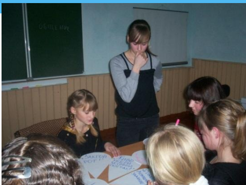
Обучающий модуль «Организация мастер – класса».

Создание условий для индивидуального развития