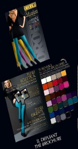
IL DEPLIANT THE BROCHURE

For the launching of the new fashion All Colors line, Oroblù met your requirements. To make the purchasing and the following re-orders easier, tights and leggings will be marketed in boxes of 3 pairs of the same color and size, while knee-highs in boxes of 5 pairs.