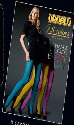
IL CARTELLO VETRINA THE SHOWCARD

ALL COLORS will be your next great success. To draw your customers attention, Oroblù realized a strong visual impact showcard and a brochure explaining in detail all the advantages of the new fashion opaque All Colors line.