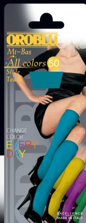
Mi-Bas - Socks