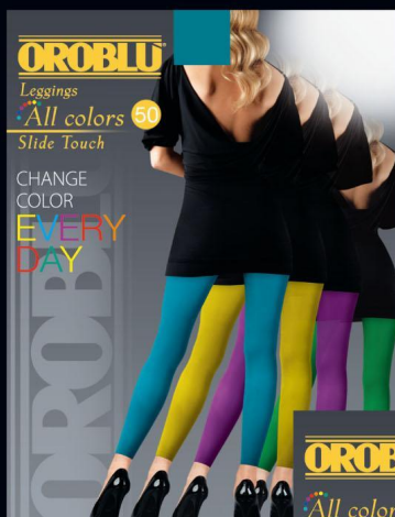
Panta - Leggings