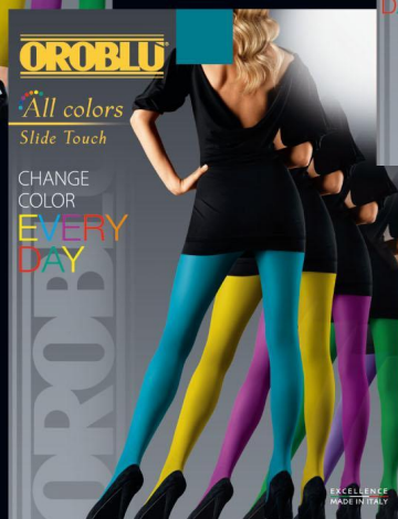
Collant - Tights