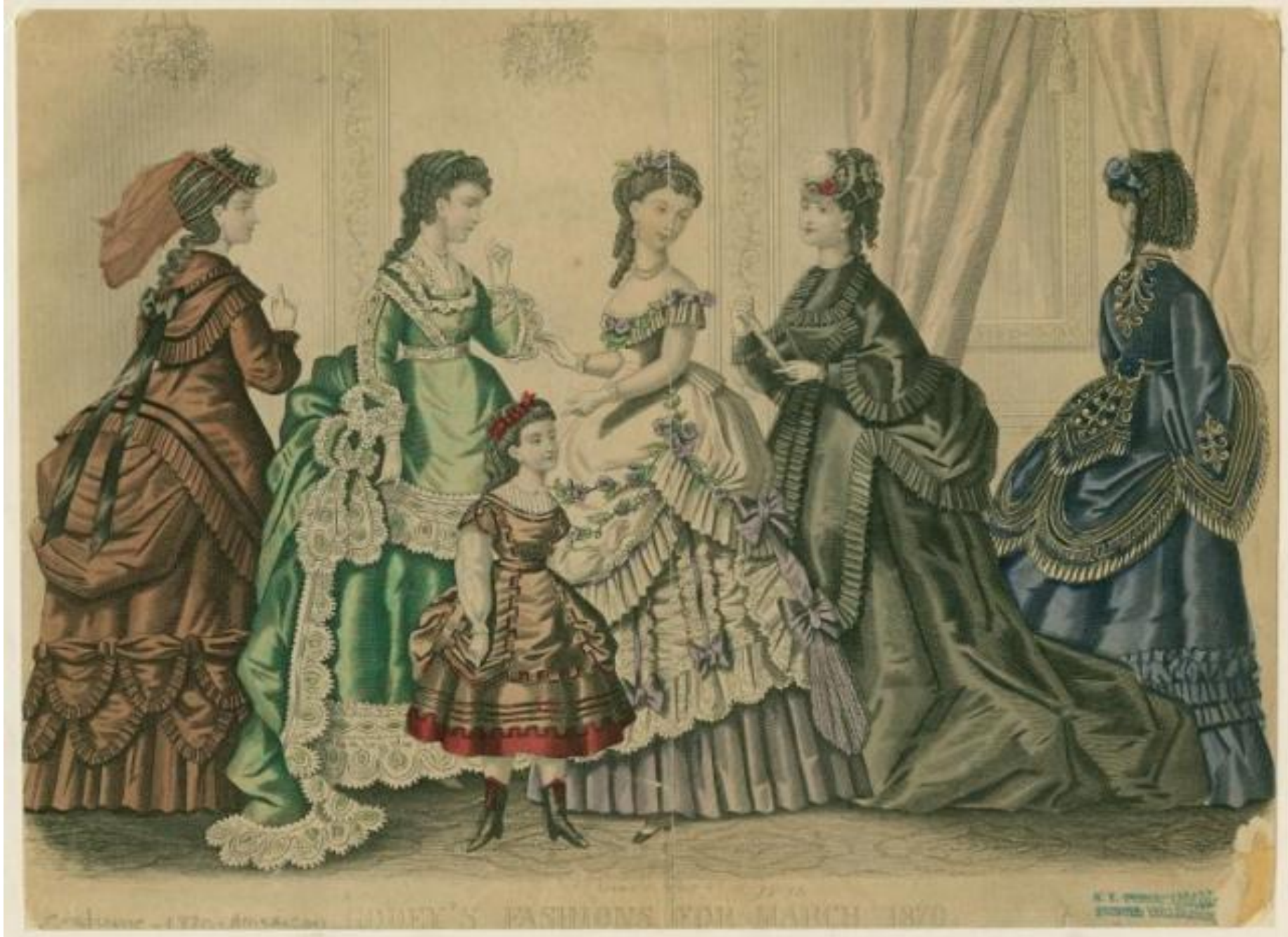
Costume - 172 - Illustration LADY'S FASHIONS FOR MARCH 1870. N. Y. PUBLISHED BY G. S. B. 1870.