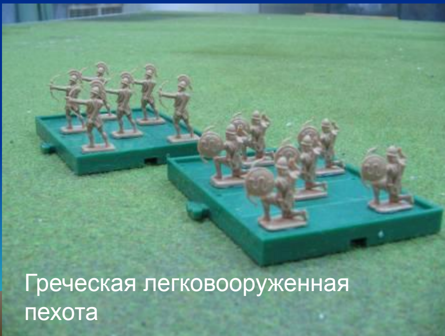
Греческая легковооруженная пехота

Отряды могут быть пешими и конными, легкими и тяжелыми или линейными