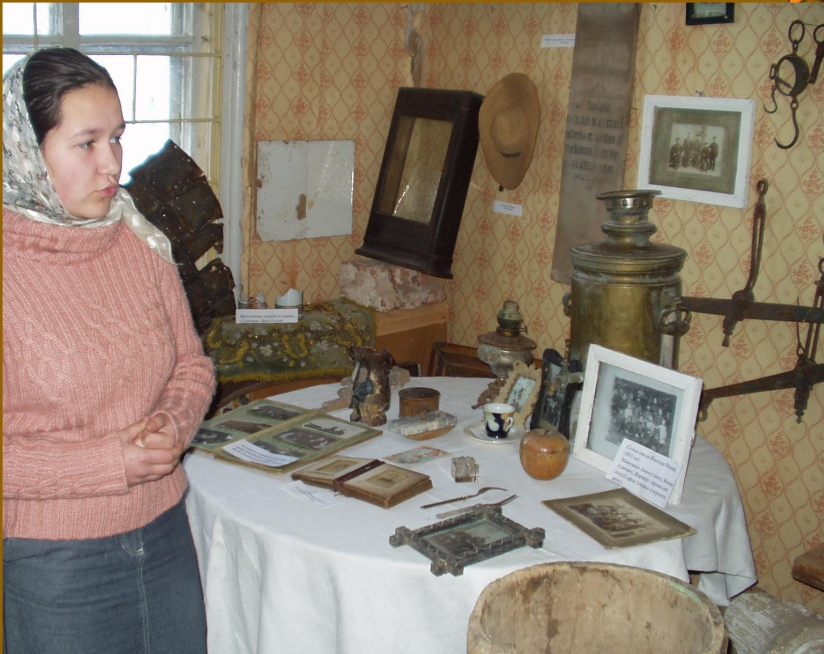
Музейно-образовательный центр г. Ижевск, ул. 29-й