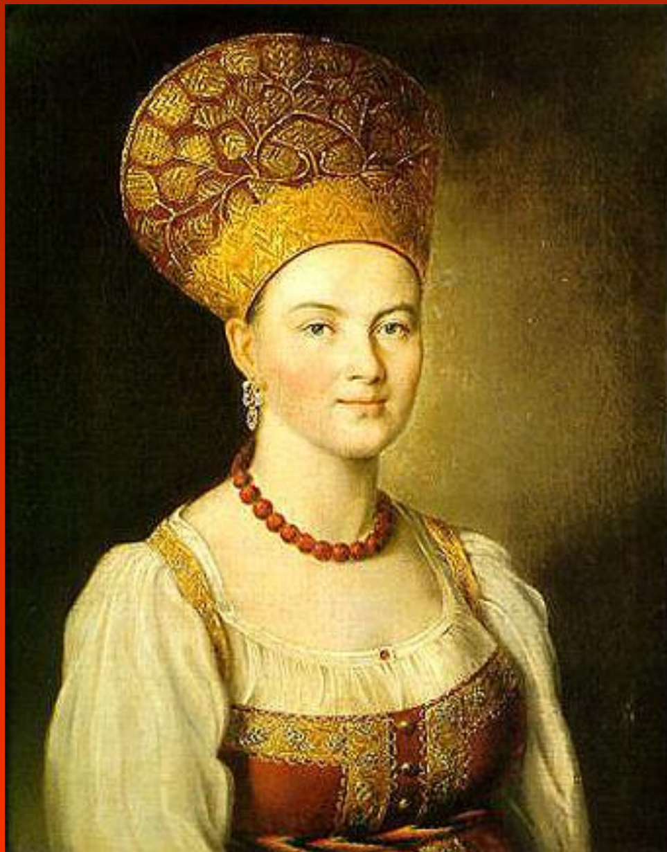
И.Аргунов. Портрет неизвестной крестьянки в русском costume.