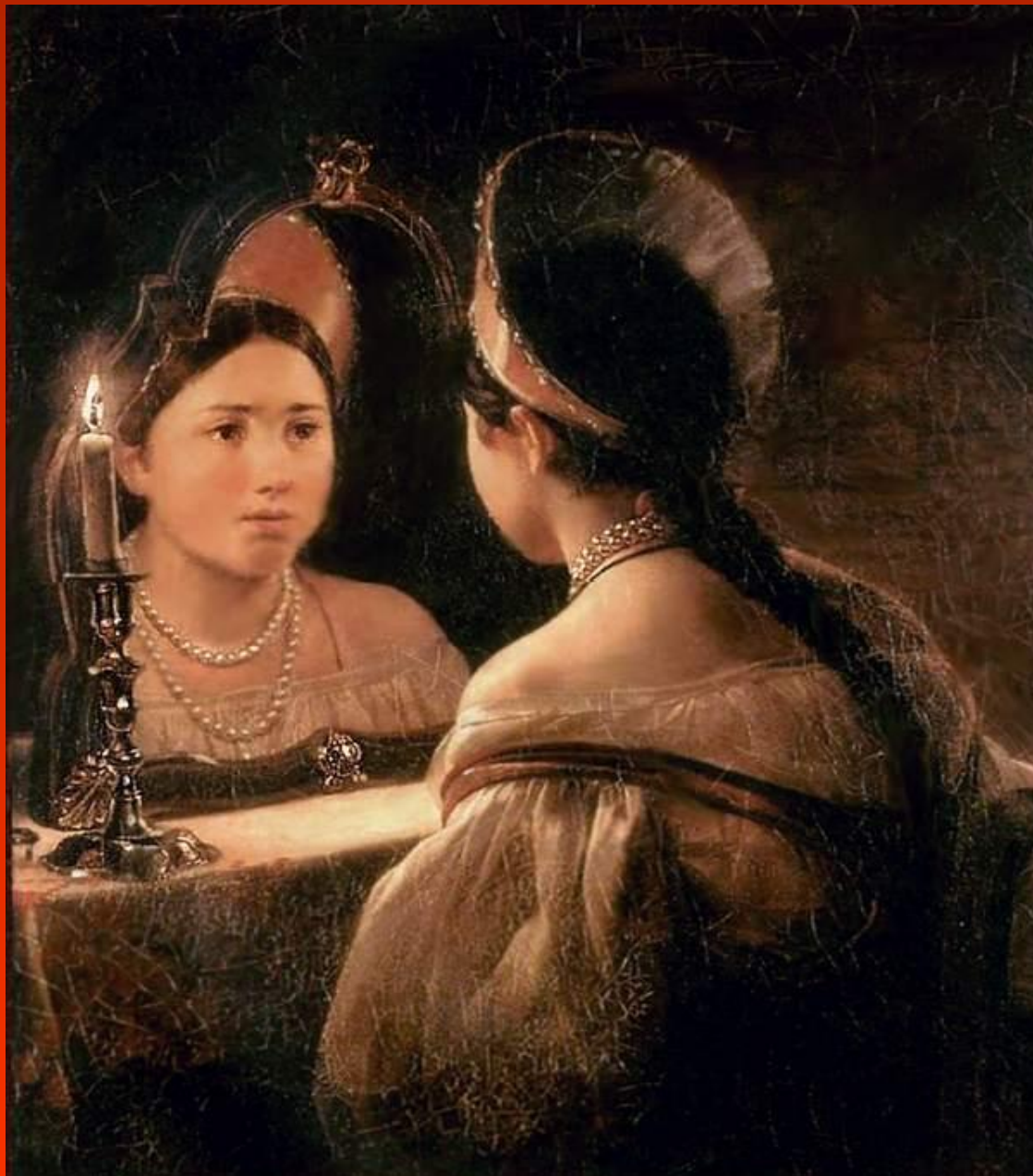
К.Брюллов. Гадающая Светлана.