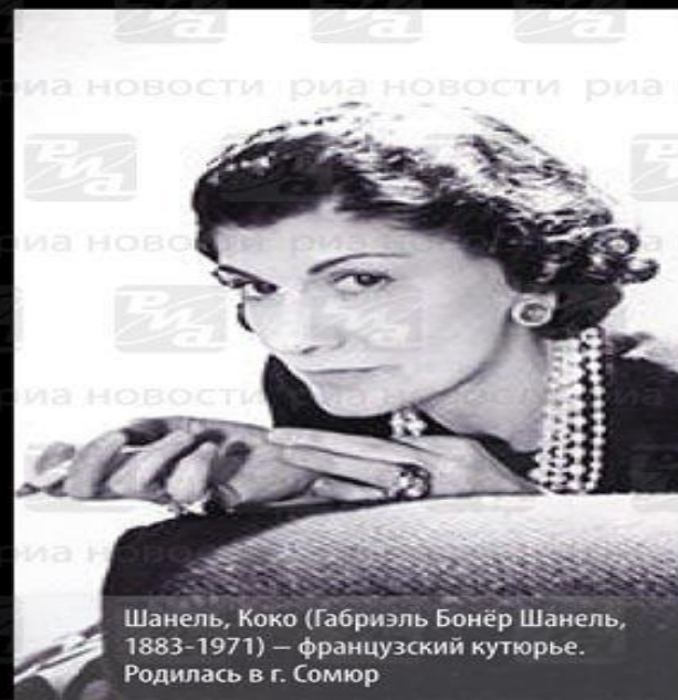
Шанель, Коко (Габриэль Бонёр Шанель, 1883–1971) – французский кутюрье. Родилась в г. Сомюр

Коко Шанель: «Главное в женщине не одежда, а милые манеры, рассудительность и строгий режим дня»