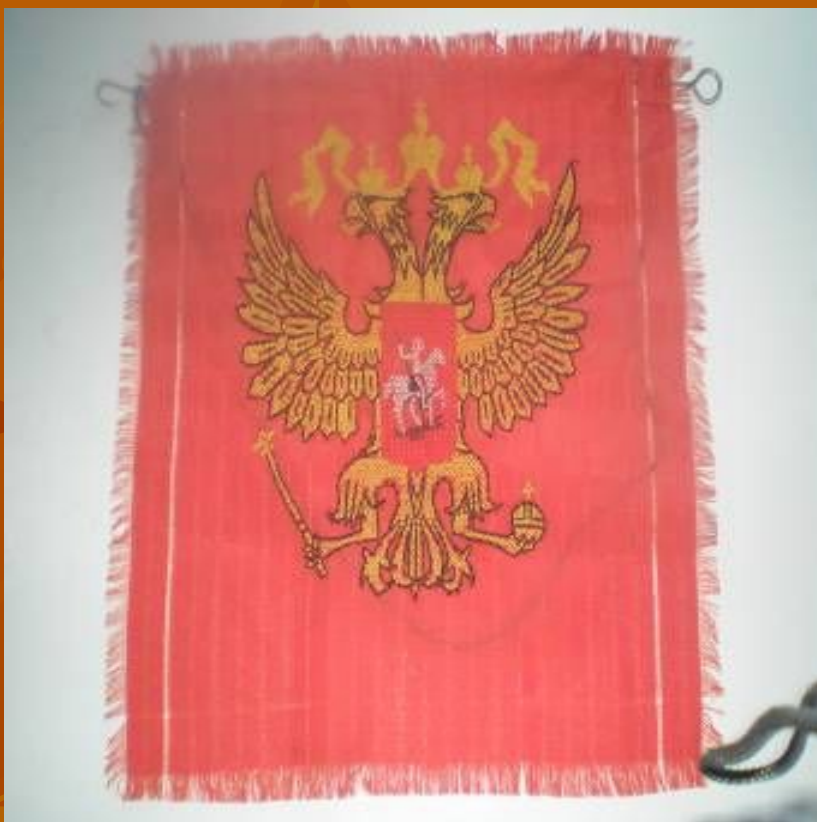
«Герб Российской Федерации» Вышивка.