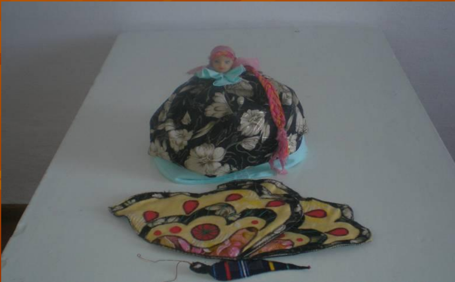
Грелка для чайника и прихватка