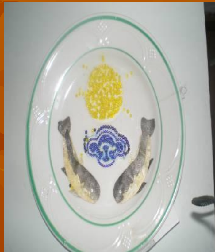
Символика школьной детской организации «Наран». Бисер, рыба кожа.