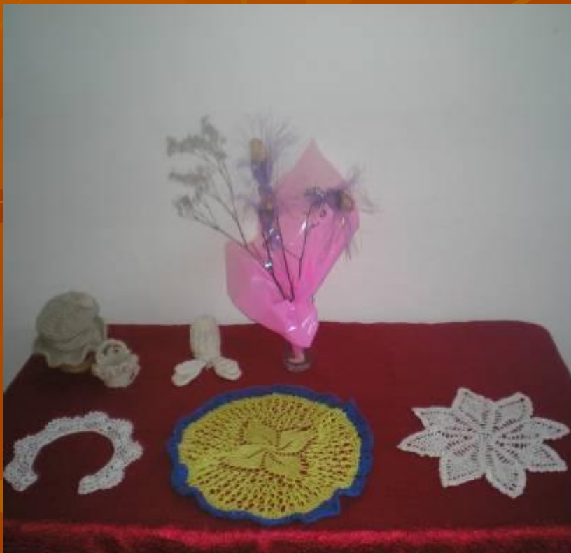
Воротнички и салфетки.