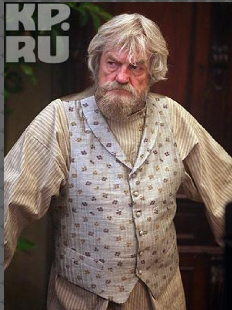
Народный артист России Леонид Кулагин в роли купца Большого. Петербург. Пивной завод.

Интересы Самсона Силыча Большова ограничены лишь сферой его купеческой деятельности, интеллектуальные запросы отсутствуют начисто.