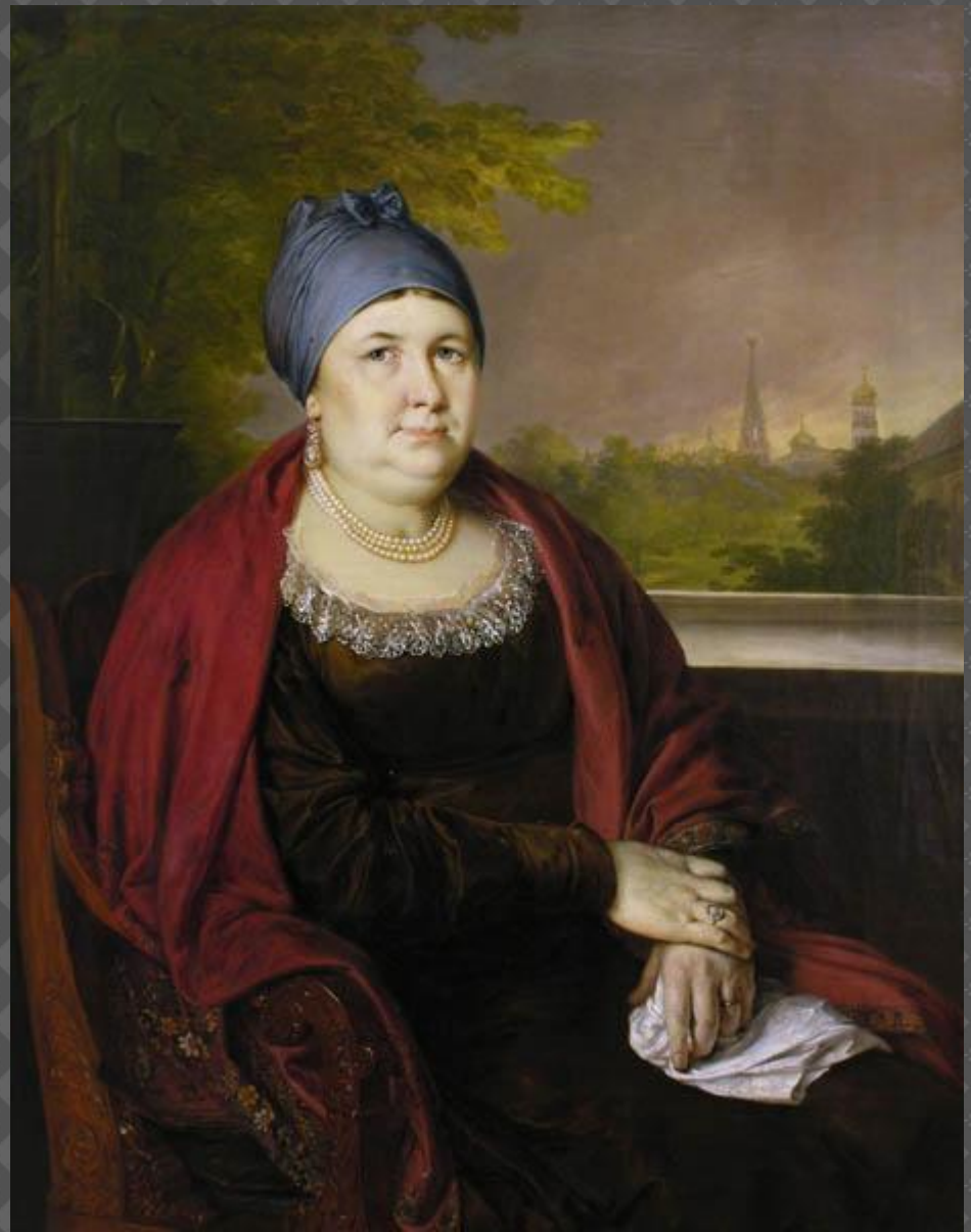
В.А. Тропинин. «Портрет купчихи в синем повойнике» (1830-е гг.)

Главная черта героини - практицизм: ей надо выгодно выдать замуж дочь Липочку, поэтому в данной жизненной ситуации одежда для купчихи незначима.