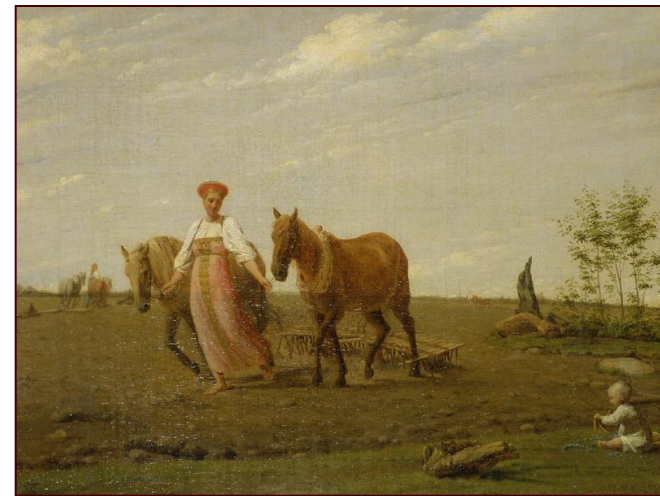
А Венецианов. Весна. На пашне. 1827г.