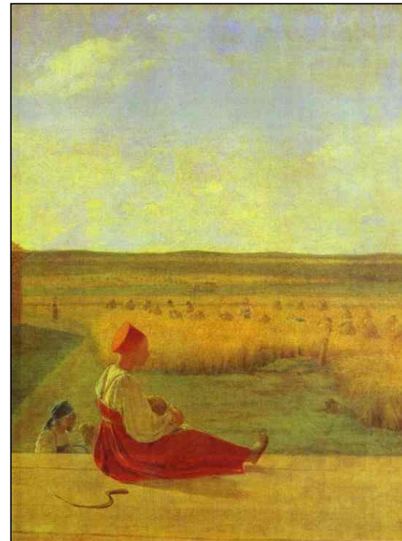
А.Венецианов. Жатва. Лето.

Как вы думаете, пошла бы женщина в своем единственном праздничном костюме на поле?