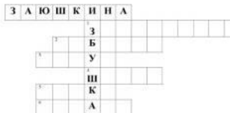
Кроссворд по русской народной сказке «Заяшккина избушка»