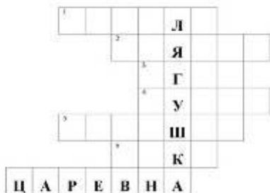
Кроссворд по русской народной сказке «Царевна - лягушка»