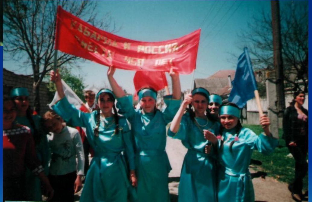
Участники танцевального конкурса