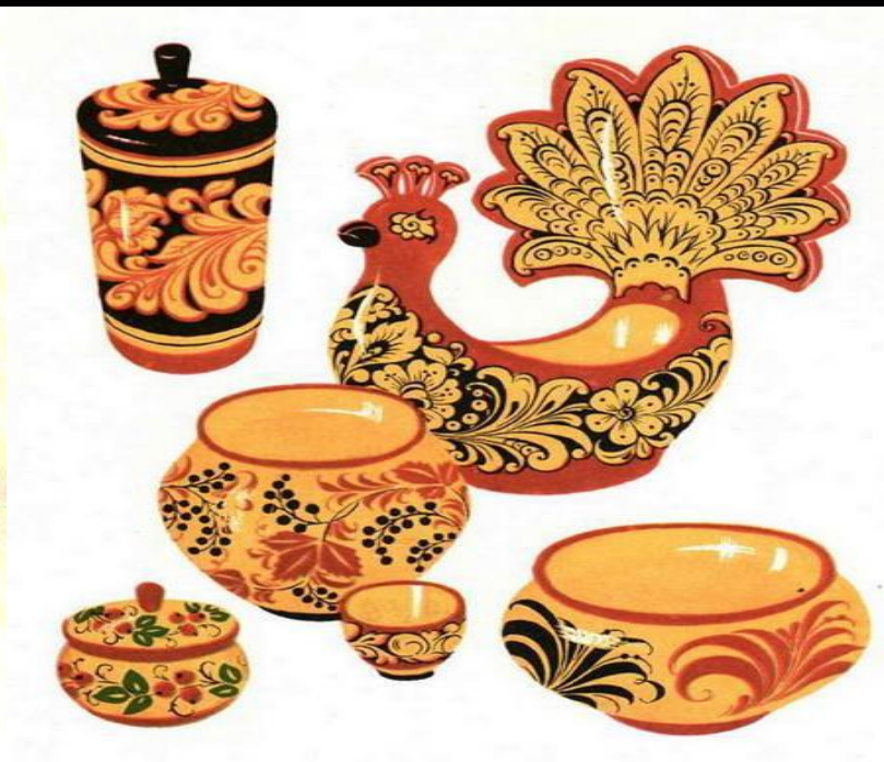
Слева: ларец-сказки Пушкина, палех, Ивановская область А.В . Борунов. Справа: хохломская роспись.