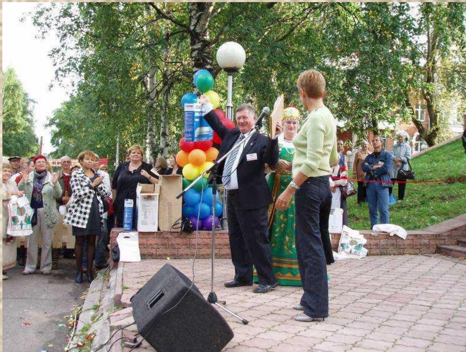
Победитель фестиваля «Зарни Кияс-2008» Республика Удмуртия