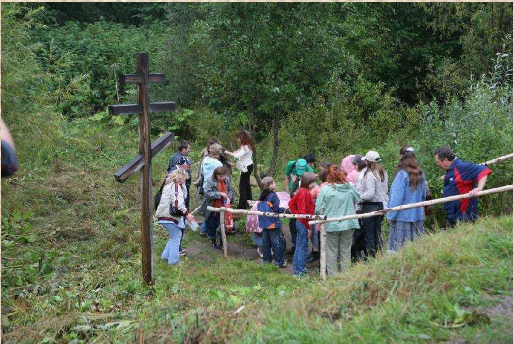
с. Ыб, святой источник