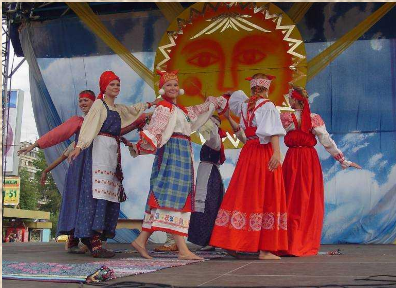
Шоу-показ костюмов «Народный стиль»