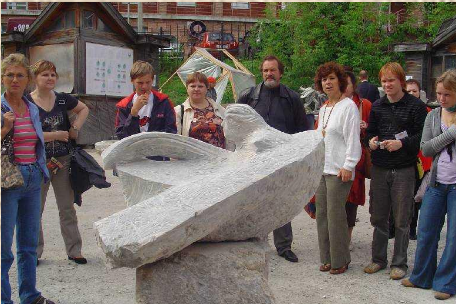
Национальная галерея Сад скульптур