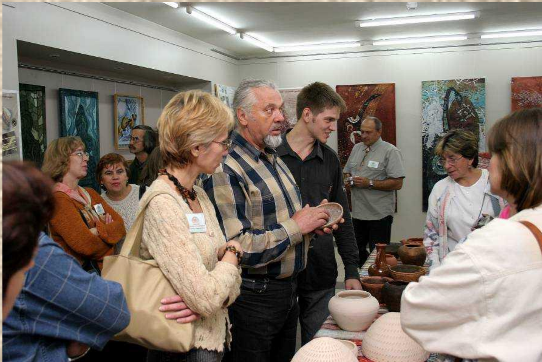
Сыктывкарский государственный университет, факультет искусств