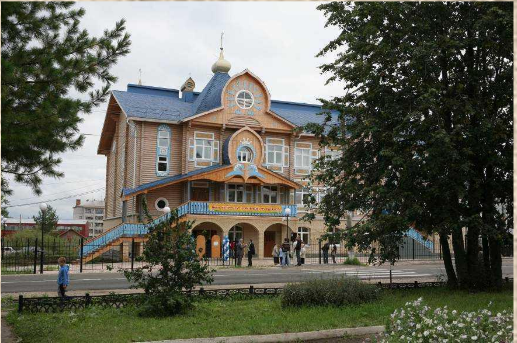
Центр ремесел «Зарань» с. Вильгорт