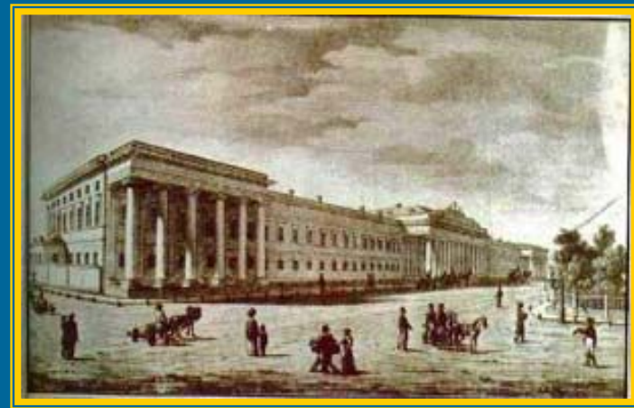
Казанский университет в XIX в.