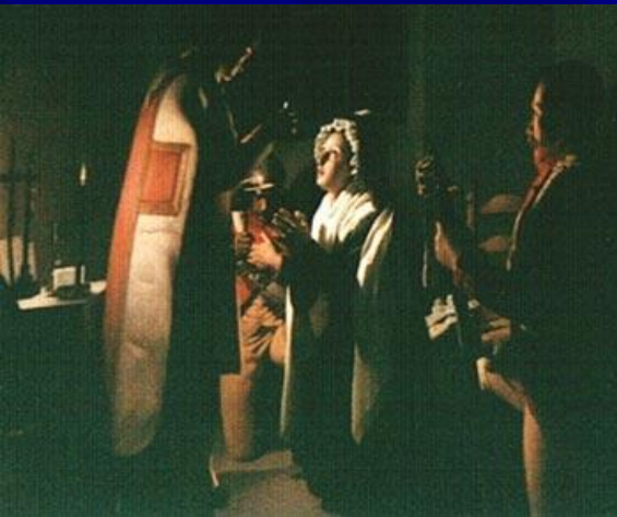
Причастие. Ночь перед казнью