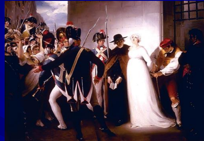
Путь на гильотину