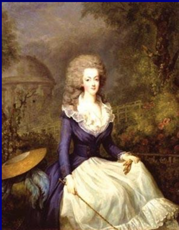
В костюме для верховой езды