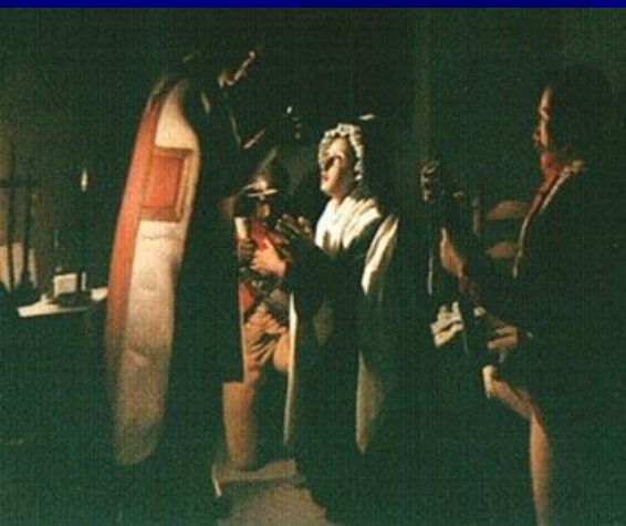
Причастие. Ночь перед казнью