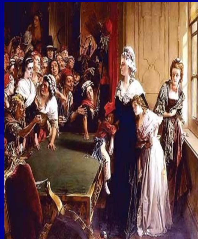
Версаль, первые тревоги