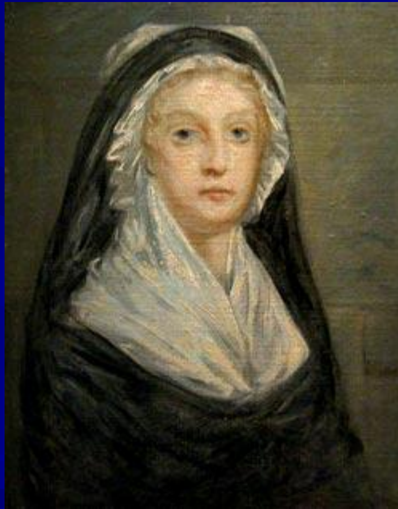
Последний портрет Марии Антуанетты