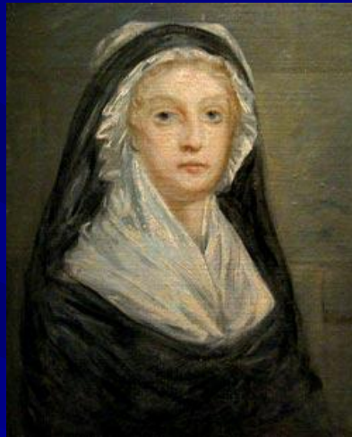
Последний портрет королевы