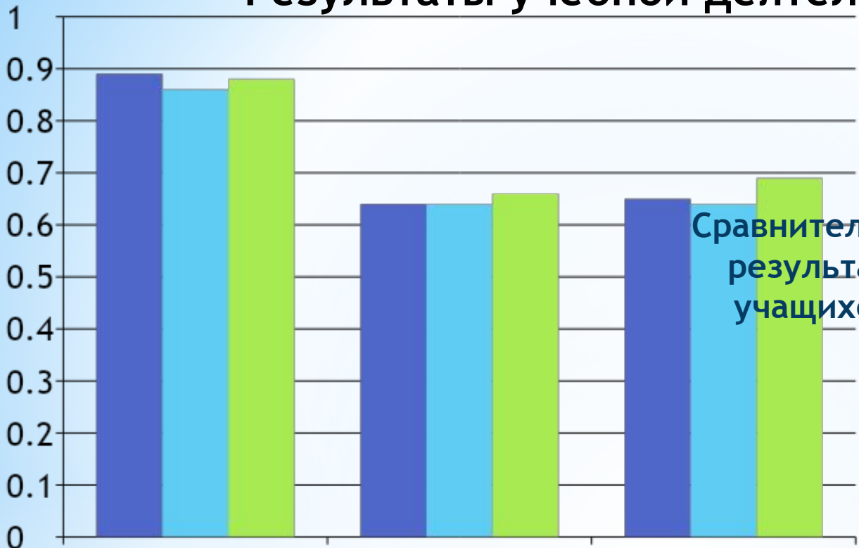
Сравнительная диаграмма результатов обучения учащихся за три года