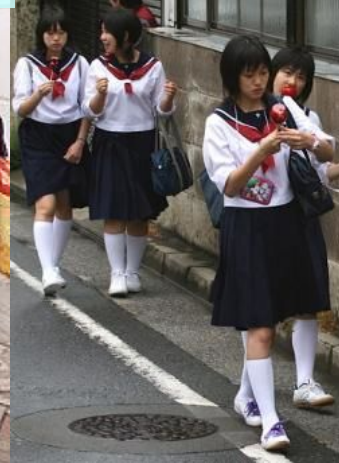
Школьная форма в Японии