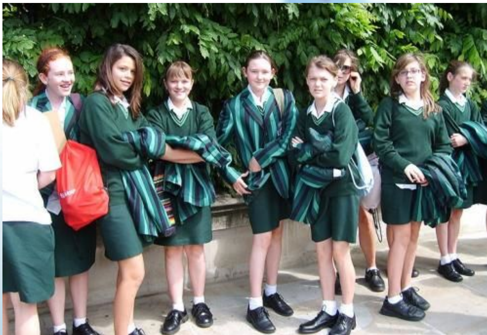
Школьная форма в Великобритании

Самой большой европейской страной, в которой существует школьная форма, является Великобритания. Во многих её бывших колониях форма не была отменена и после независимости, например в Индии, Ирландии, Австралии, Сингапуре и Южной Африке.