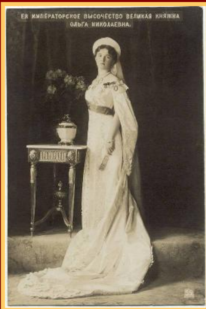
Ольга Николаевна Старшая дочь императора Николая II