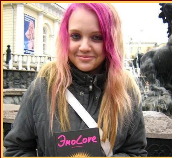
Девушка - ЭМО