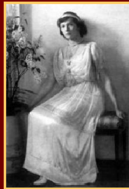
Татьяна Николаевна Вторая дочь императора Николая II