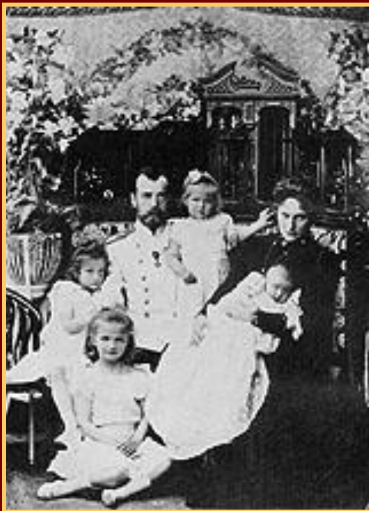
Семья императора Николая II