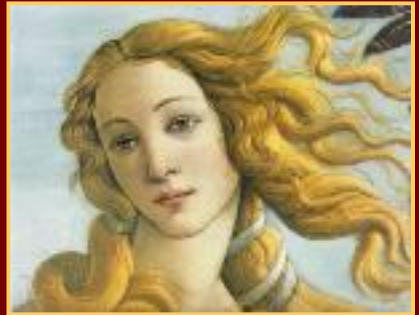
Сандро Ботичелли Рождение Венеры (фрагмент, XV)