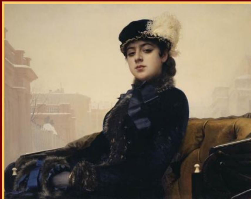
Иван Крамской Неизвестная (1883)