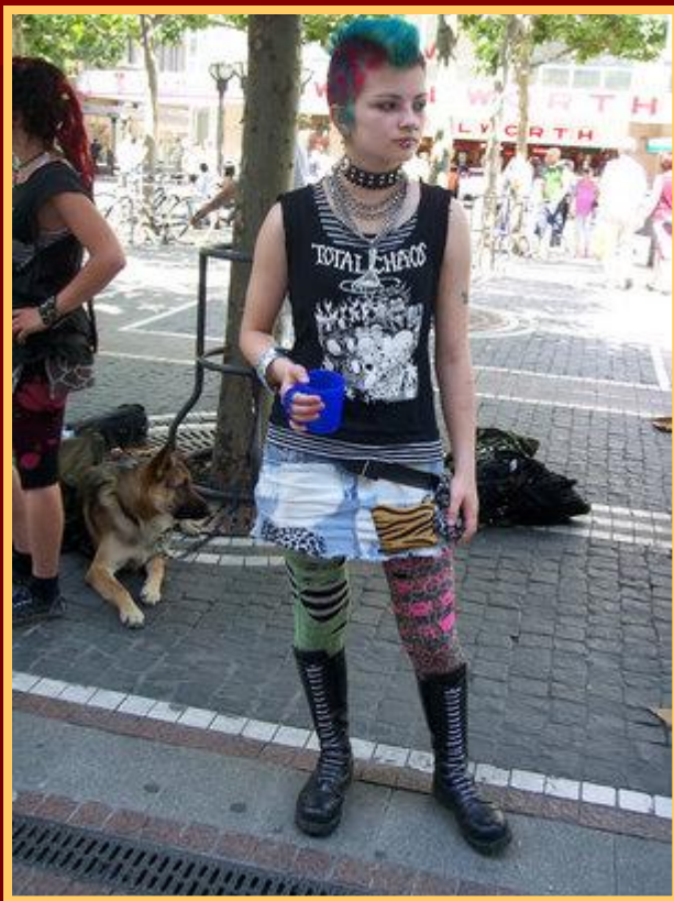
Девочка - панк