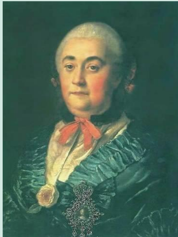
Портрет А.М.Измайловой. 1759