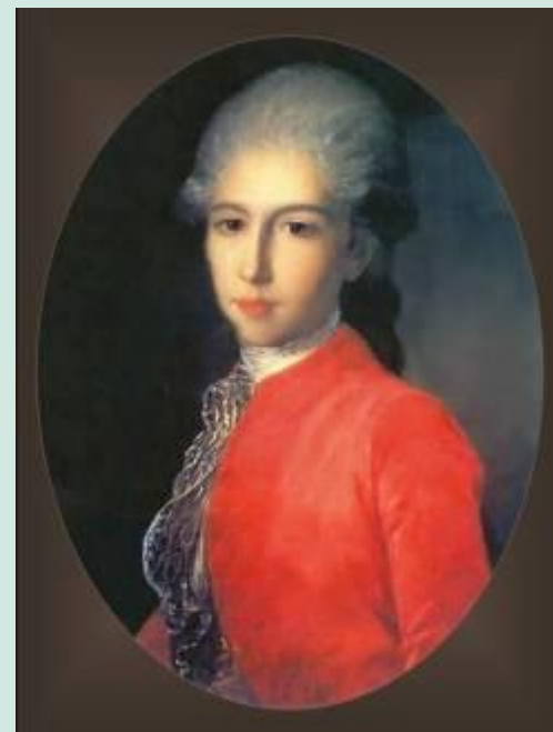
Портрет князя И.Барятинского

Ф.Рокотов- один из самых изысканных и тонких живописцев в европейском искусстве XVIII в. Это художник самобытного дарования , необычайно поэтический и лирический.