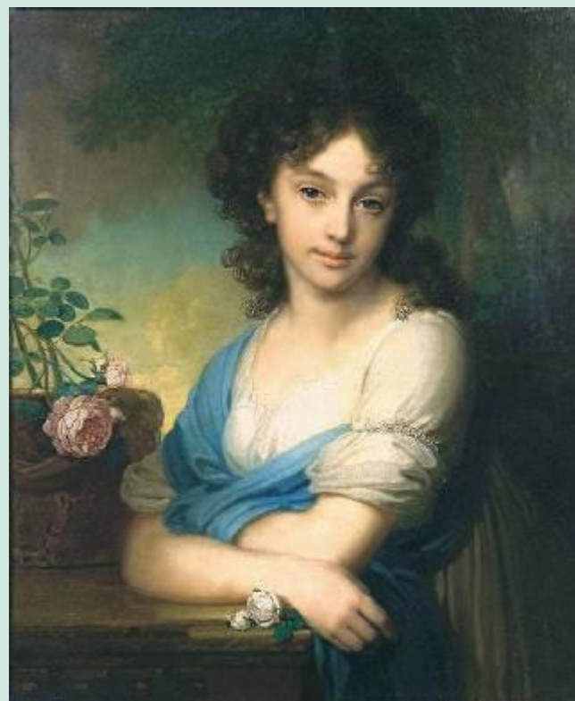
В. Боровиковский . Портрет Е.А.Нарышкиной

XVIII век в живописи- это век портрета. Портрет играл ведущую роль в русском изобразительном искусстве. В этой области русские художники не только достигли уровня европейской живописи, но и по праву заняли место среди крупнейших портретистов той эпохи.