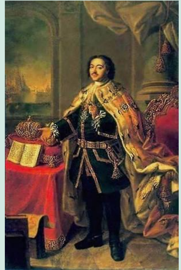
Портрет императора Петра I

Расцвет русского портрета падает на вторую половину XVIII в. А. П. Антропов- одна из самых примечательных фигур ломоносовской поры в русской художественной культуре