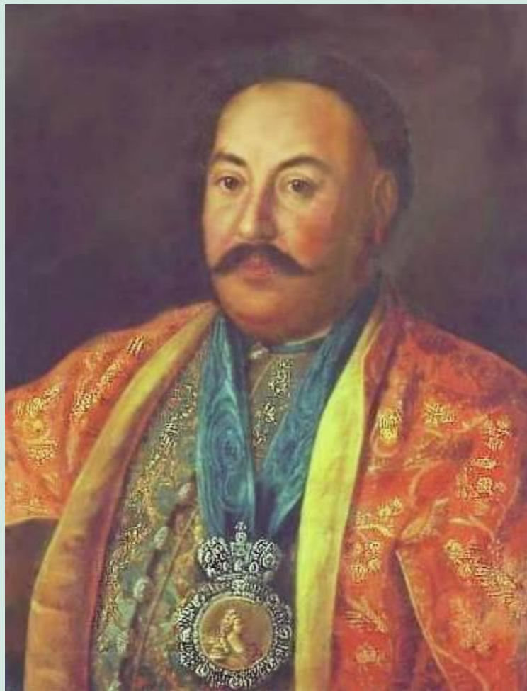
Портрет атамана Ф. Краснощекова. 1761