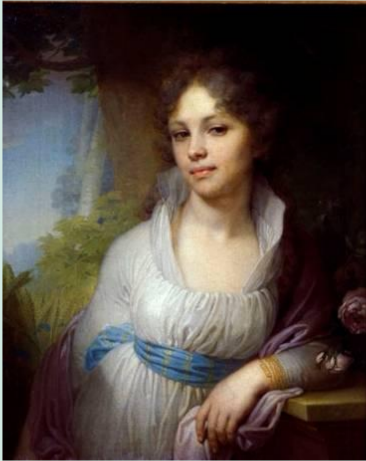
Портрет М.И. Лопухиной.1797