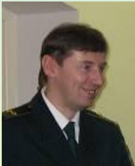
Пограничное Управление ФСБ России По Республике Карелия