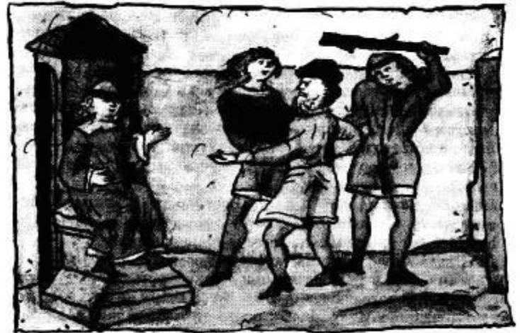
Пленение князя Всеволода Большое Гнездо смоленским князем. Миниатюра из летописи

Пленённый Всеволод у трона Смоленского князя.