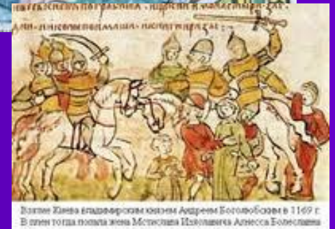
Взятие Киева владимирским князем Андреем Боголюбским в 1169 г. В плен тогда попал князь Мстислав Изяславича Алескс Боголюбский