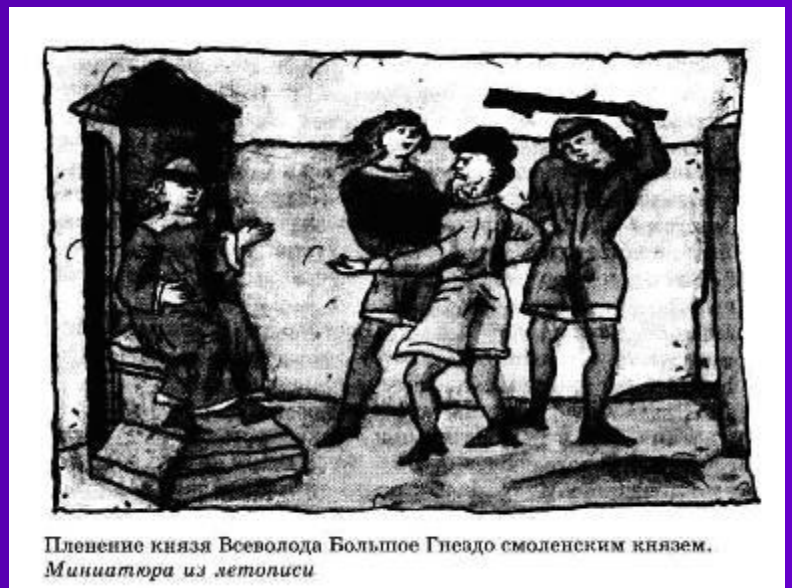
Пленение князя Всеволода Большое Гнездо смоленским князем. Миниатюра из летописи

Пленённый Всеволод у трона Смоленского князя.