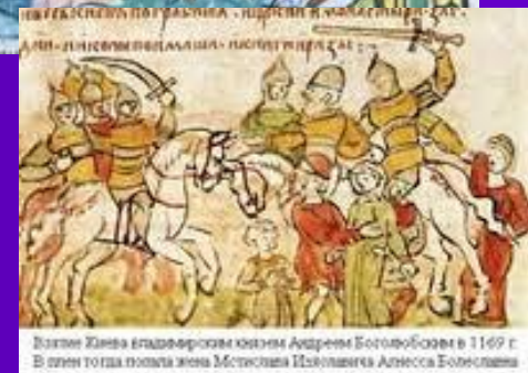
Визити Киевн владарьскии князем Андреем Боголюбским в 1169 г. В шлем тогда пошла жена Мстислава Изяславича Алесия Боголюбшии