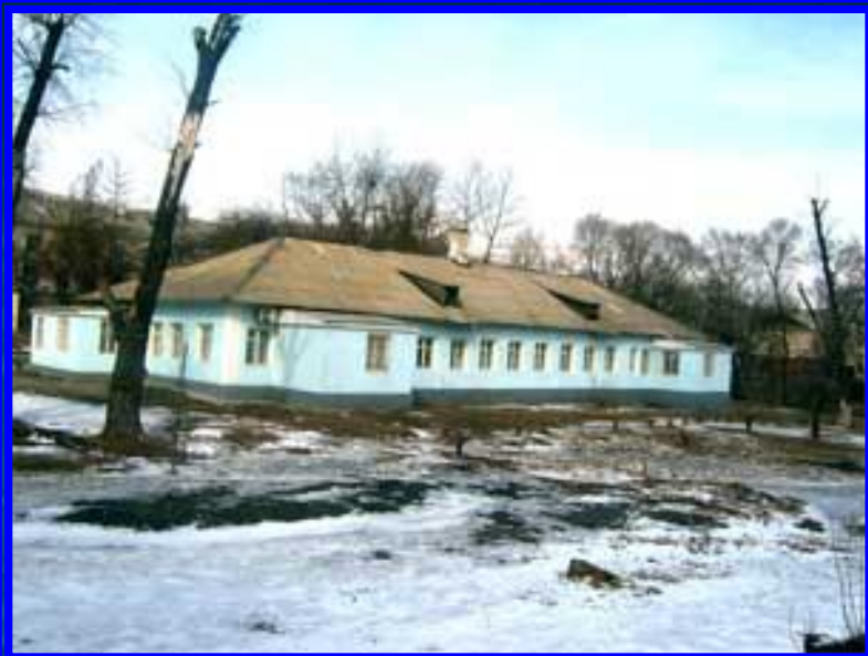
Общий вид госпиталя в 2007 г. Вид слева.