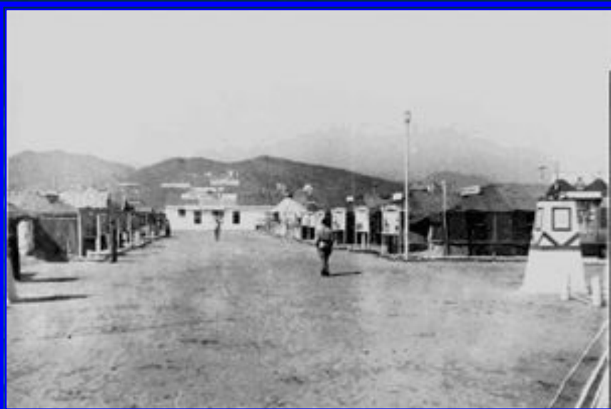
Общий вид лагеря военнопленных японцев