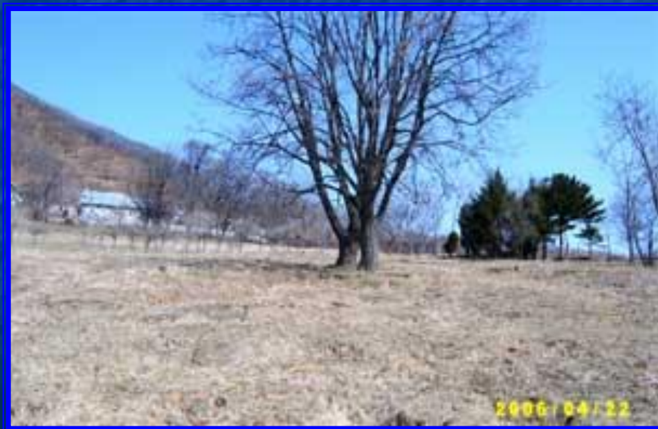
Общий вид кладбища в 2006г.