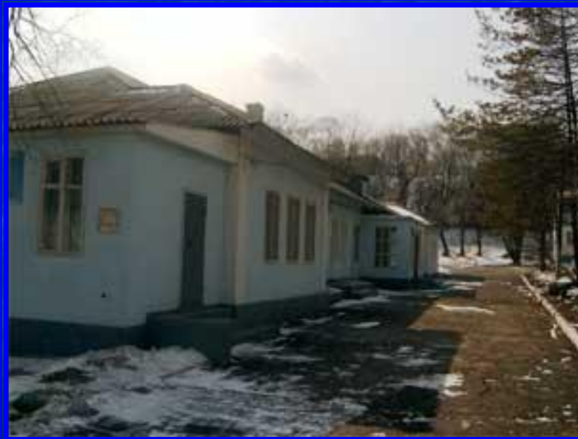
Вид на госпиталь со стороны внутреннего дворика (2007 г.)