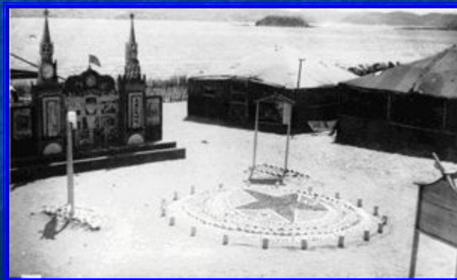
Временный палаточный лагерь японских военнопленных на берегу бухты в районе Бархатной