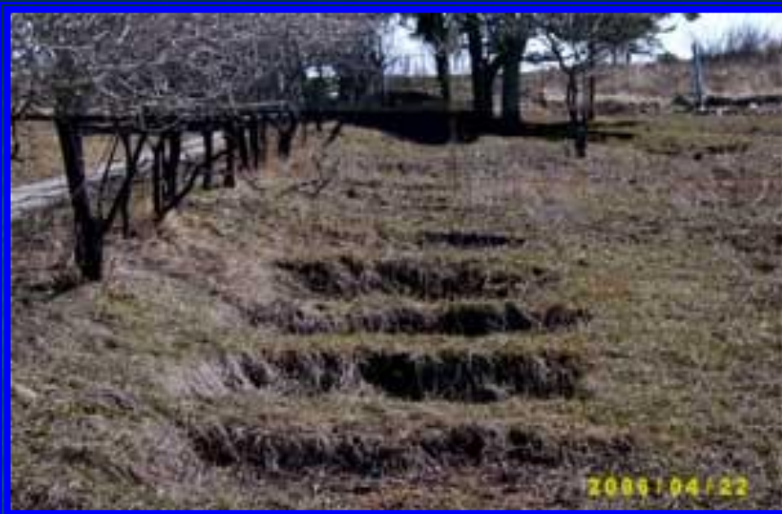
Могилы после эксгумации (2006 г.)