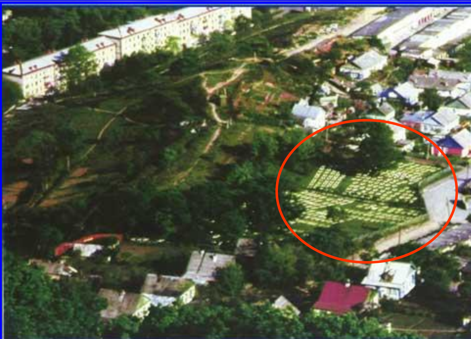
Кладбище японских военнопленных, до 2004 г. расположенное по улице Сенявина