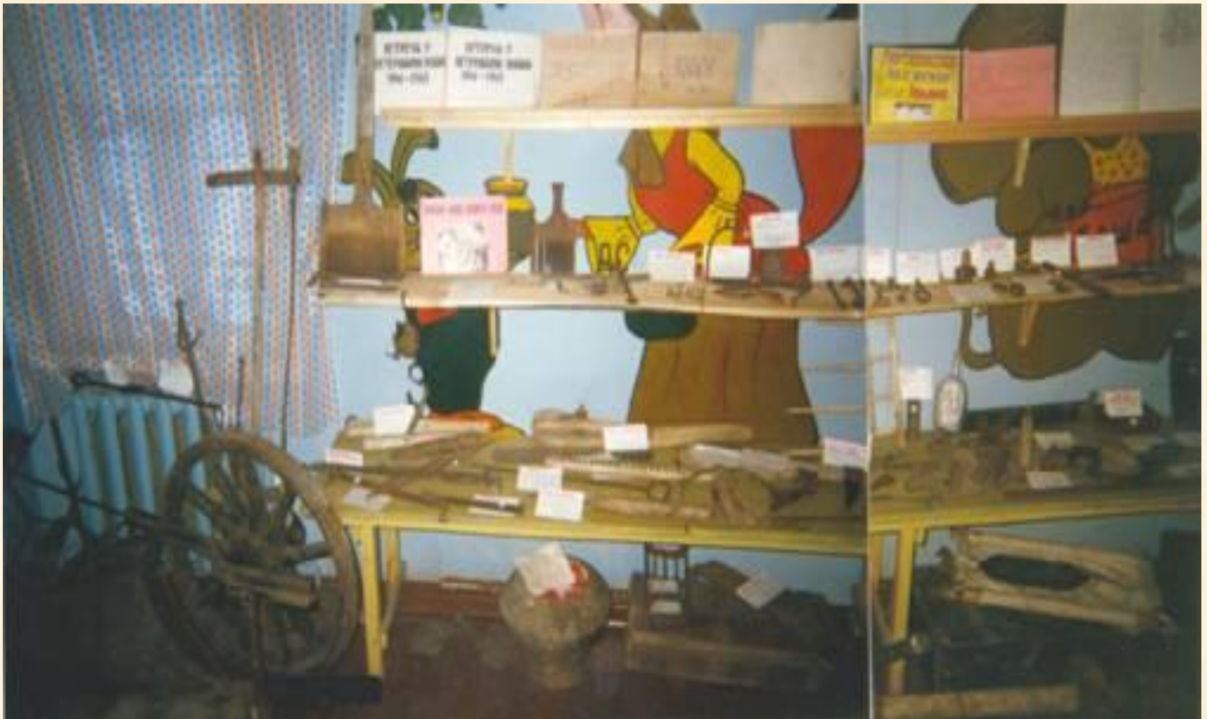
Орудия труда челдонов.