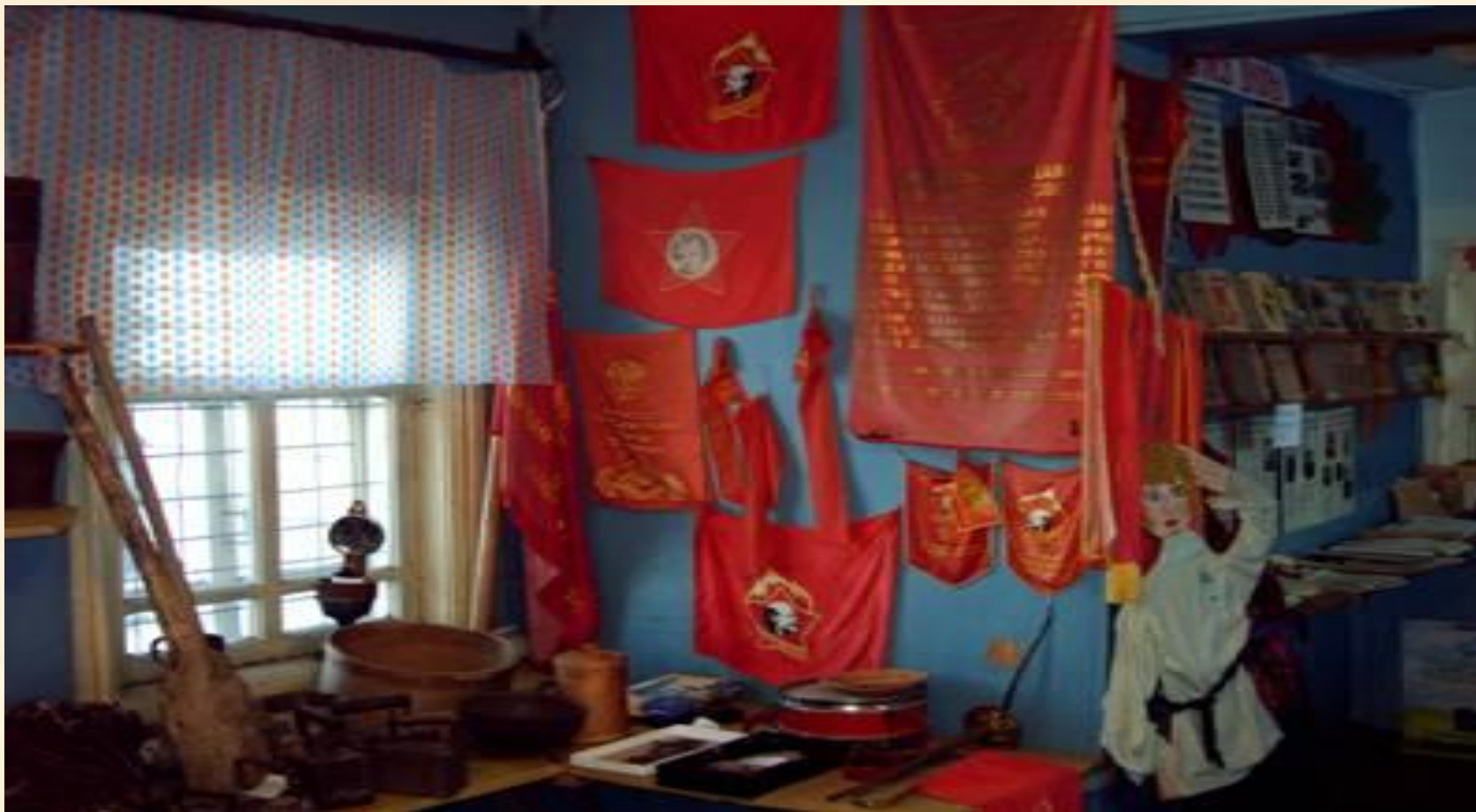
Атрибутика школьной пионерской организации.