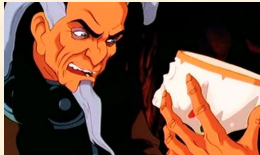
Чаша из черепа Святослава, окованного золотом, по повелению хана Кури