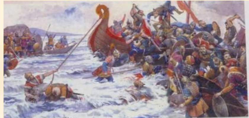
Гибель Святослава в бою с печенегами. Современный рисунок