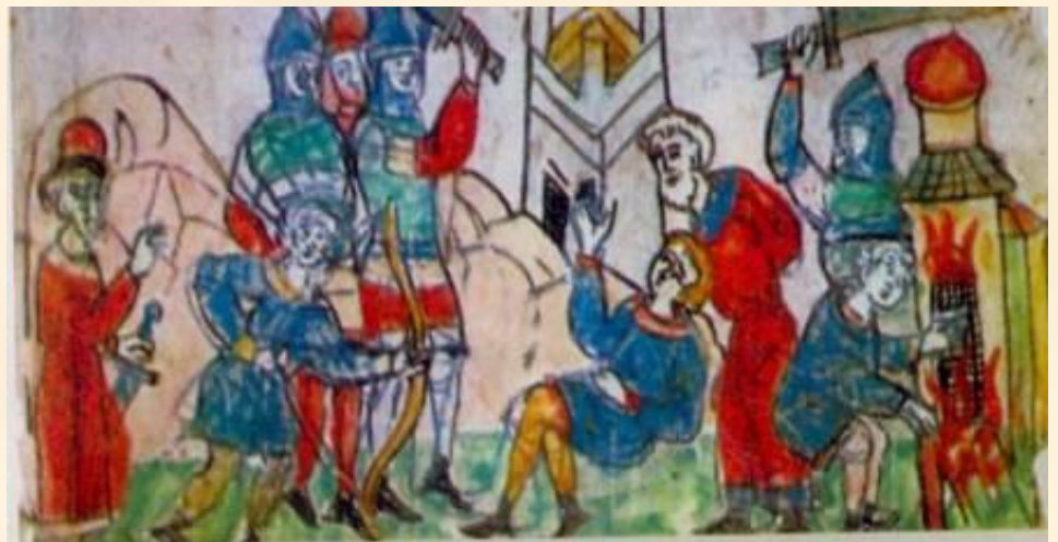
Воцарение Олега в Киеве. Древняя миниатюра