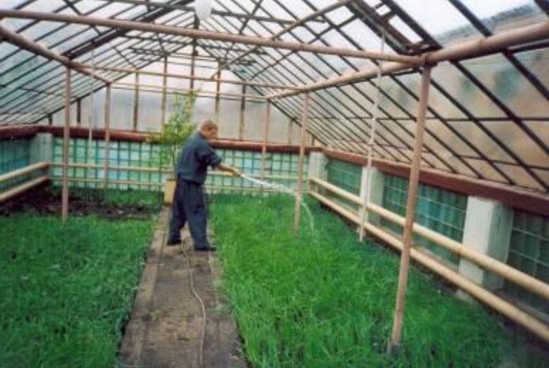
Т Е П Л И Ц А