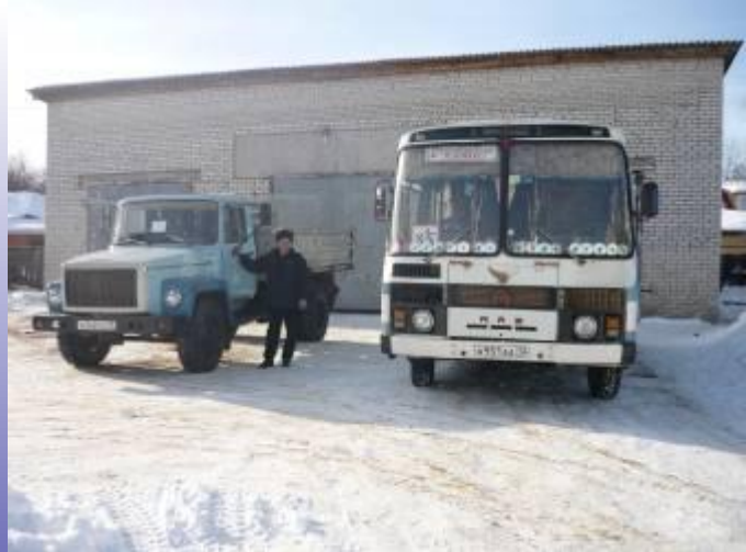
Г А Р А Ж

За короткий срок пущена в эксплуатацию баня. Построены: теплица, гараж, овощехранилище. Наличие теплицы, пришкольного участка, подсобного хозяйства, овощехранилища дает возможность обеспечению воспитанников свежими овощами и фруктами.