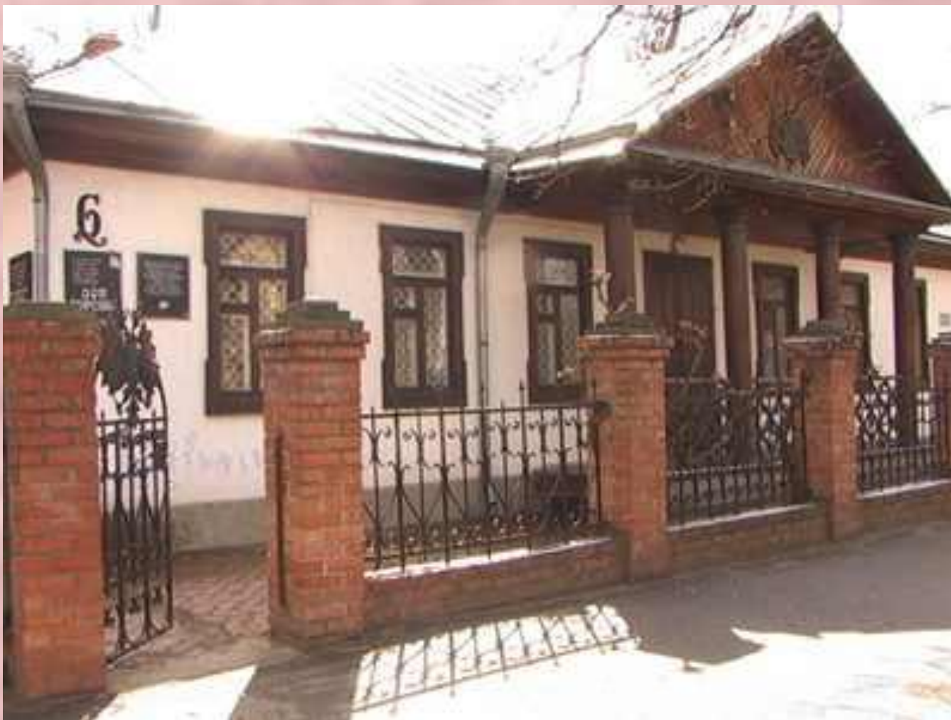
Дом атамана Ф.Я. Бурсака, начало XIX в.