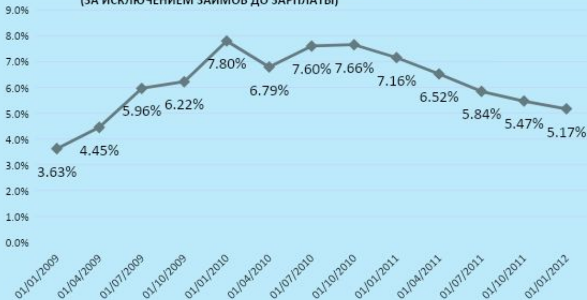
Средний показатель портфеля в риске более 30 дней (ЗА ИСКЛЮЧЕНИЕМ ЗАЙМОВ ДО ЗАРПЛАТЫ)

Устойчивое снижение показателя портфеля в риске больше 30 дней в 2011 году снизился с 7.16% до 5.17% .