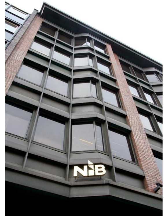
Здание НИБ в Хельсинки