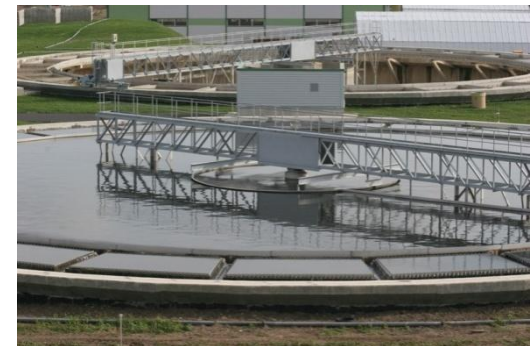
Юго-западные очистные сооружения в Санкт-Петербурге.