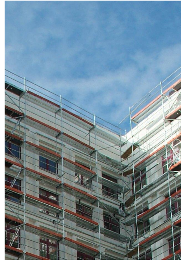
Реконструкция здания больницы Вильнюсского Университета.