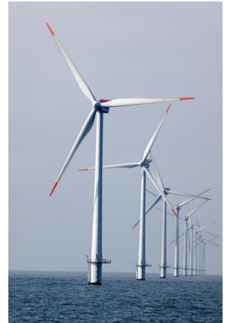
Ветряной парк Horns Rev II в Северном море.