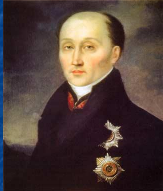
М.М.Сперанский преподавал право