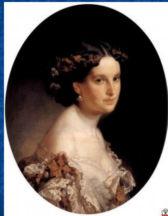
жена царя Мария Александровна