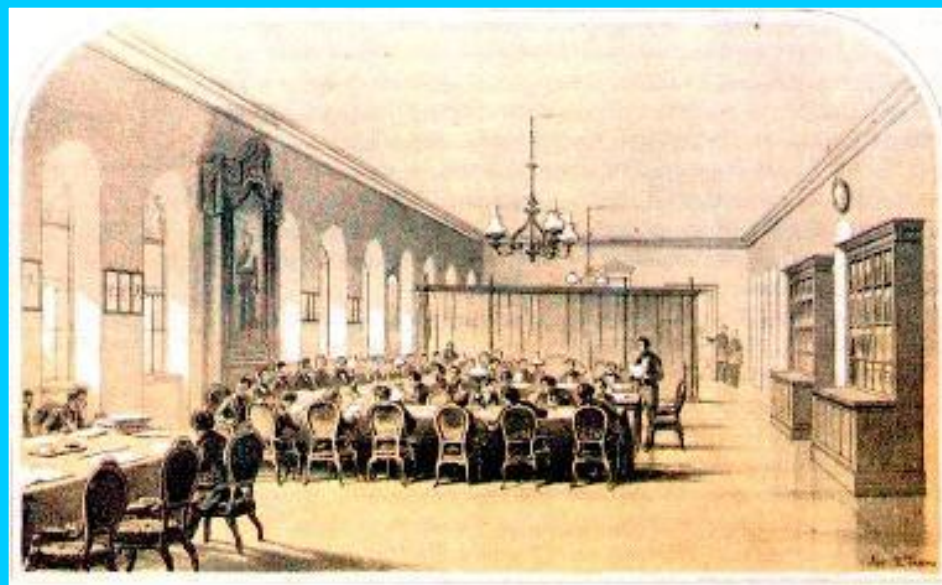
Заседание Редакционной комиссии по крестьянскому вопросу.