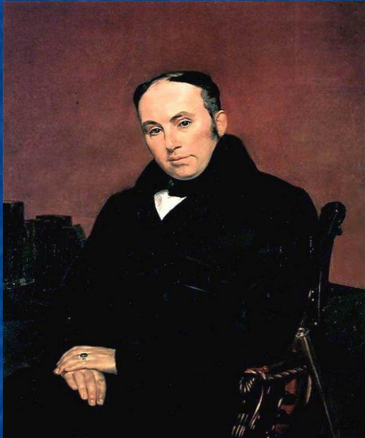
Главный наставник цесаревича В.А. Жуковский