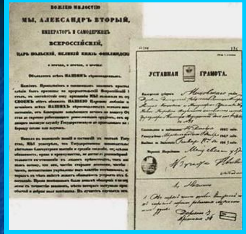
Документы Великой реформы.