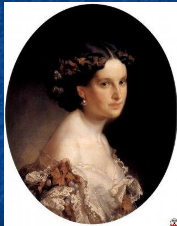
жена царя Мария Александровна