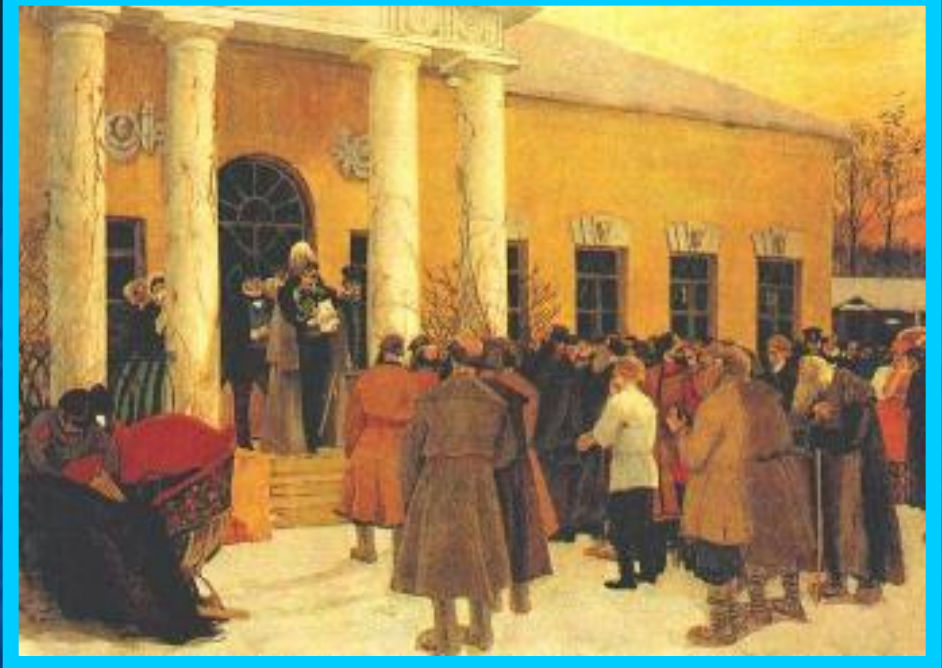
Освобождение крестьян. ( Б.Кустодиев)