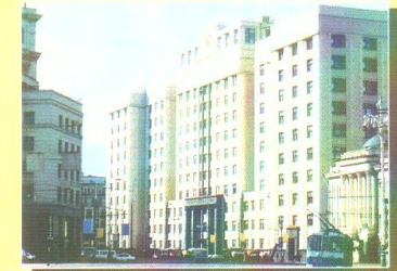
Здание Государственной Думы Российской Федерации