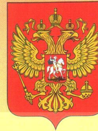
Герб Российской Федерации