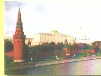
Московский Кремль — резиденция президента Российской Федерации

КОНСТИТУЦИЯ РОССИЙСКОЙ ФЕДЕРАЦИИ ГЛАВА 1. Статья 1. Российская Федерация – Россия есть демократическое федеративное правовое государство с республиканской формой правления.