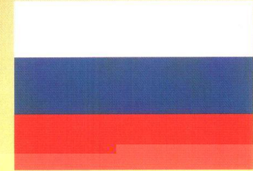
Государственный флаг Российской Федерации

КОНСТИТУЦИЯ РОССИЙСКОЙ ФЕДЕРАЦИИ ГЛАВА 1. Статья 1. Российская Федерация – Россия есть демократическое федеративное правовое государство с республиканской формой правления.