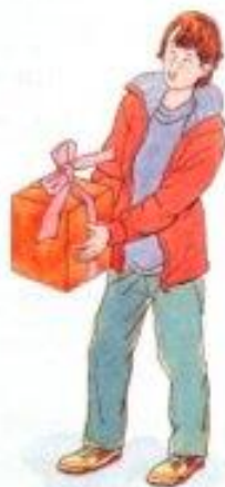
С подарком на день рождения