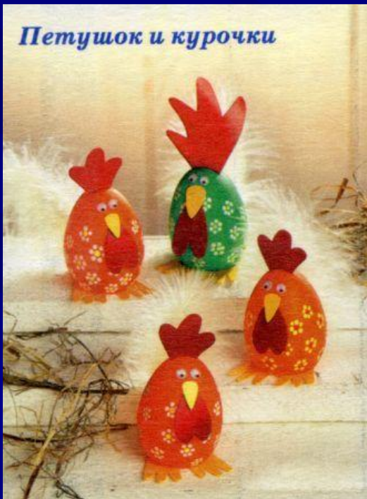
Петушок и курочки