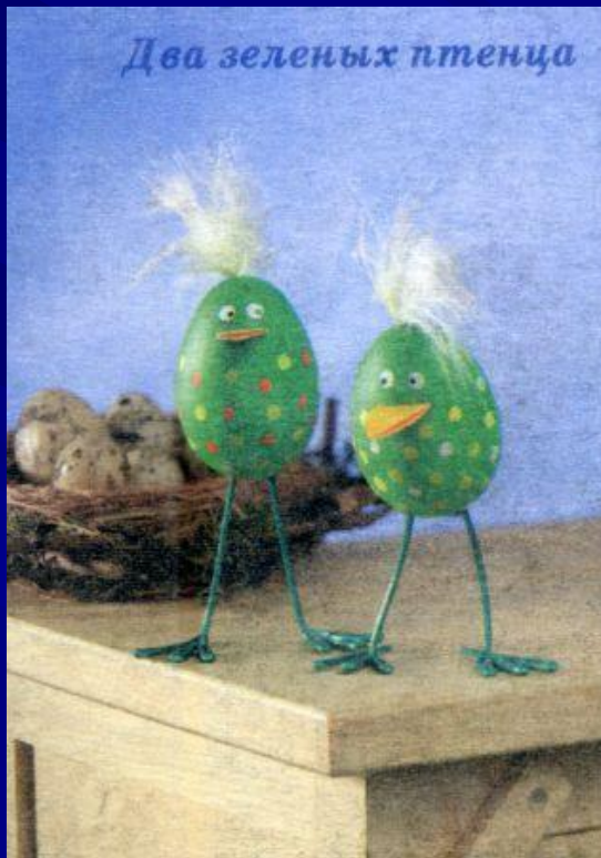
Два зеленых птенца