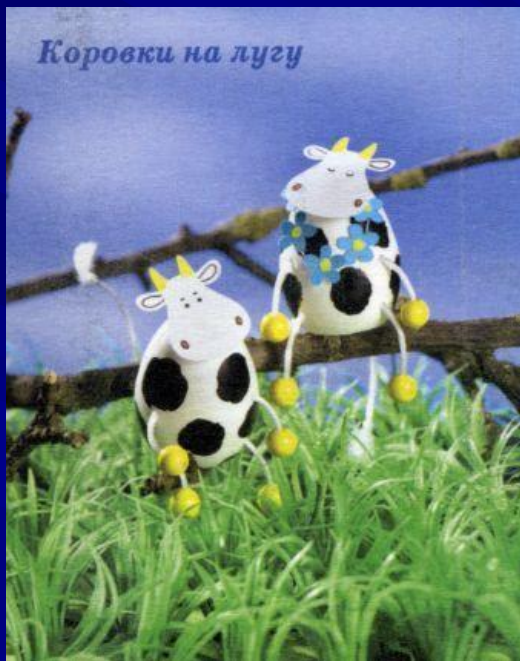
Коровки на лугу