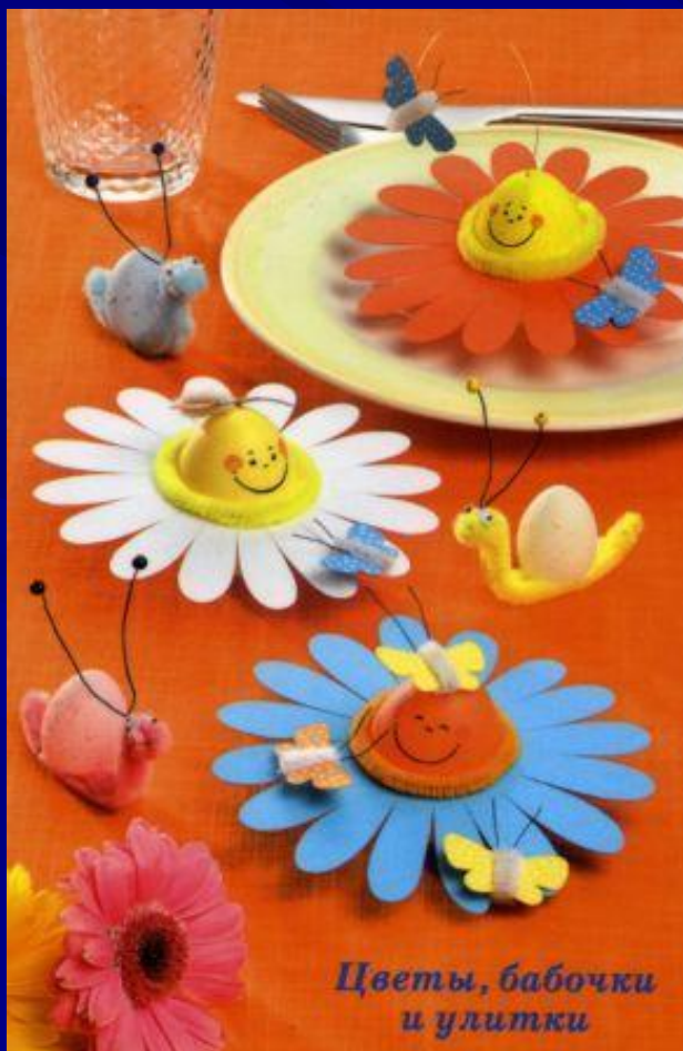
Цветы, бабочки и улитки