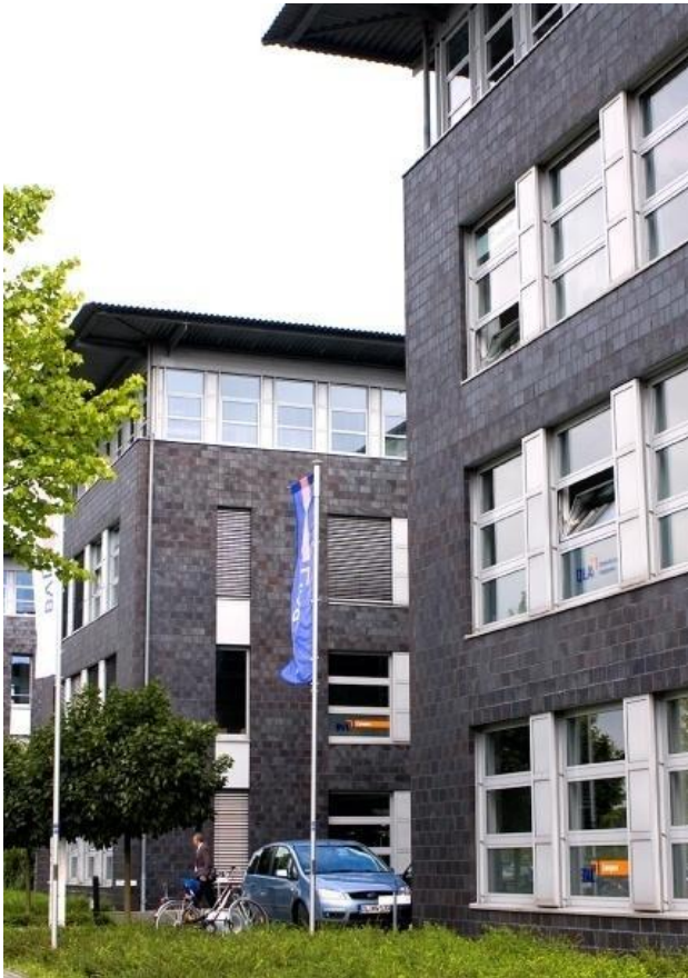
Universitätsallee 18, Technologiepark Bremen