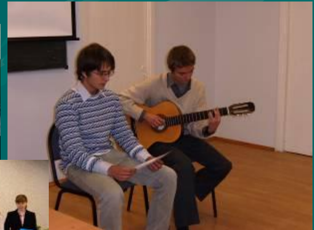
ВЕЧЕР АВТОРСКОЙ ПЕСНИ