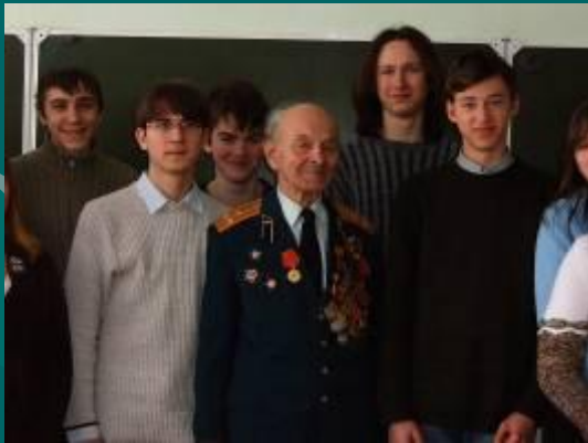
ВСТРЕЧИ С ИНТЕРЕСНЫМИ ЛЮДЬМИ