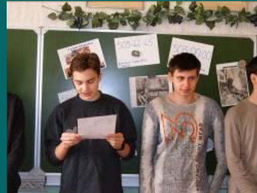
ЧАС О СЕРЬЁЗНОМ