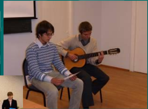
ВЕЧЕР АВТОРСКОЙ ПЕСНИ