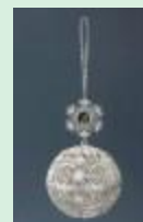
Нашла в Интернете