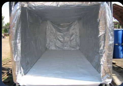
Лайнер бэг (под нафталин)