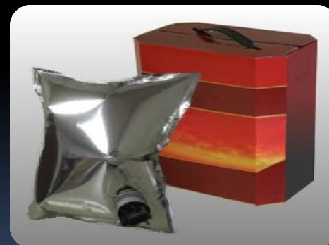
Bag in Box