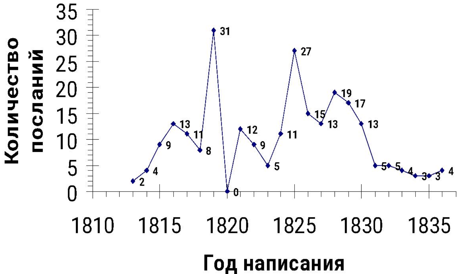
Рис.2. Графическая зависимость количества написанных стихотворных посланий от года их создания